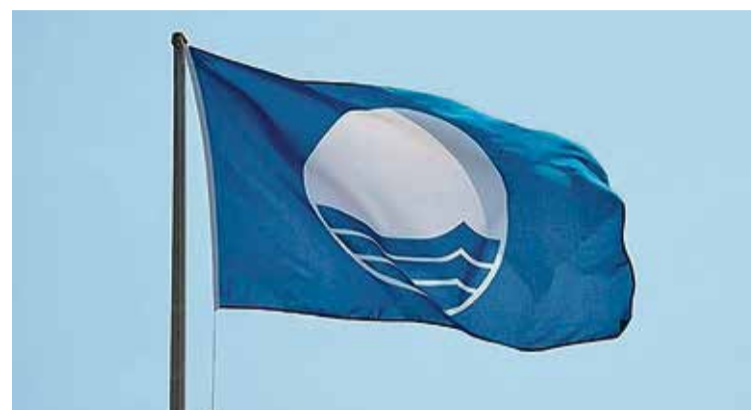
JURAT INTERNACIONAL. Distintiu de la Foundation for Environmental Education HN

■ A poques setmanes de la temporada oficial de bany, s'han donat a conèixer les certificacions de qualitat amb el distintiu de Bandera Blava. En el cas de l'Alt Empordà el renoven tres platges i quatre ports. Es tracta de les platges de Grifeu, a Llançà; la del Port de Llançà, i la platja d'Empuriabrava de Castelló d'Empúries. Pel que fa als ports guardonats, hi ha el port de Llançà (Club Nàutic Llançà); el del Port de la Selva (Club Nàutic Port de la Selva); el port esportiu de Roses (Port de Roses SA) i el port de l'Escala (Club Nàutic l'Escala).