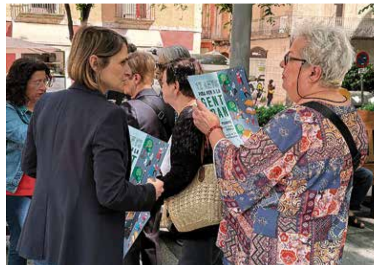
PRESENTACIÓ DE LA FIRA. Amb representants institucionals i socials

Aquesta 12a edició presenta un programa amb propostes que