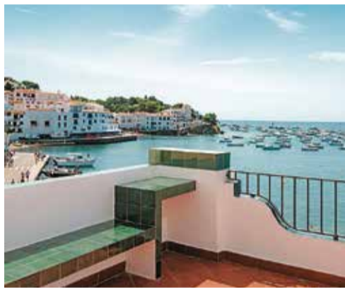
CADAQUÉS. Eixida al mar