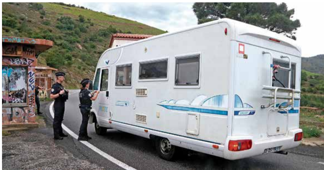
COLL DE BELITRES. Un total de 45 agents faran torns per vigilar aquest coll i el de Banyuls, també durant la nit

REESTRUCTURACIÓ DE TOT EL SERVEI. El comissari i director inter-