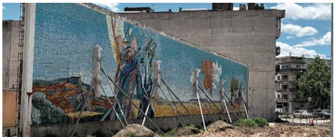
CINC VISIONS DEL PAISATGE EMPORDANÈS. Pujolboira, Lleixà, Ansón, Ministral i Roura en són els autors G. VISA

L'actuació al voltant de la presó va suposar l'enderrocament del mur perimetral del recinte. Tot un espai que comprèn els 5.730 m 2 dels terrenys que envolten l'antic penal. Les obres qüestionaven, en un principi, si es podria mantenir la ubicació del mural del Grup 69, però tots s'ha pogut fer compatible. No ha estat necessari el canvi d'ubicació d'aquesta obra