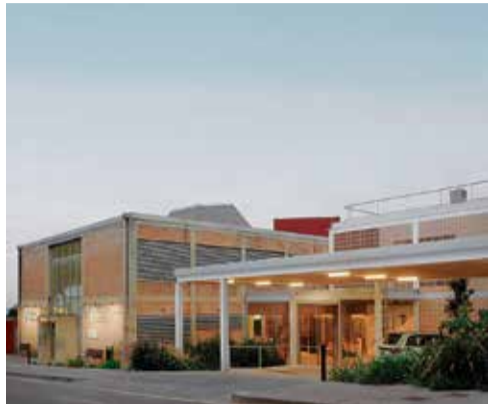
L'ESCALA. Ampliació del CAP Moisès Broggi

Els premiats es donaran a conèixer el 29 de maig. Mentrestant, la seu del COAC a Girona acull una exposició de la selecció, que serà itinerant a Figueres, Olot i Banyoles, fins al 28 de juny. ■