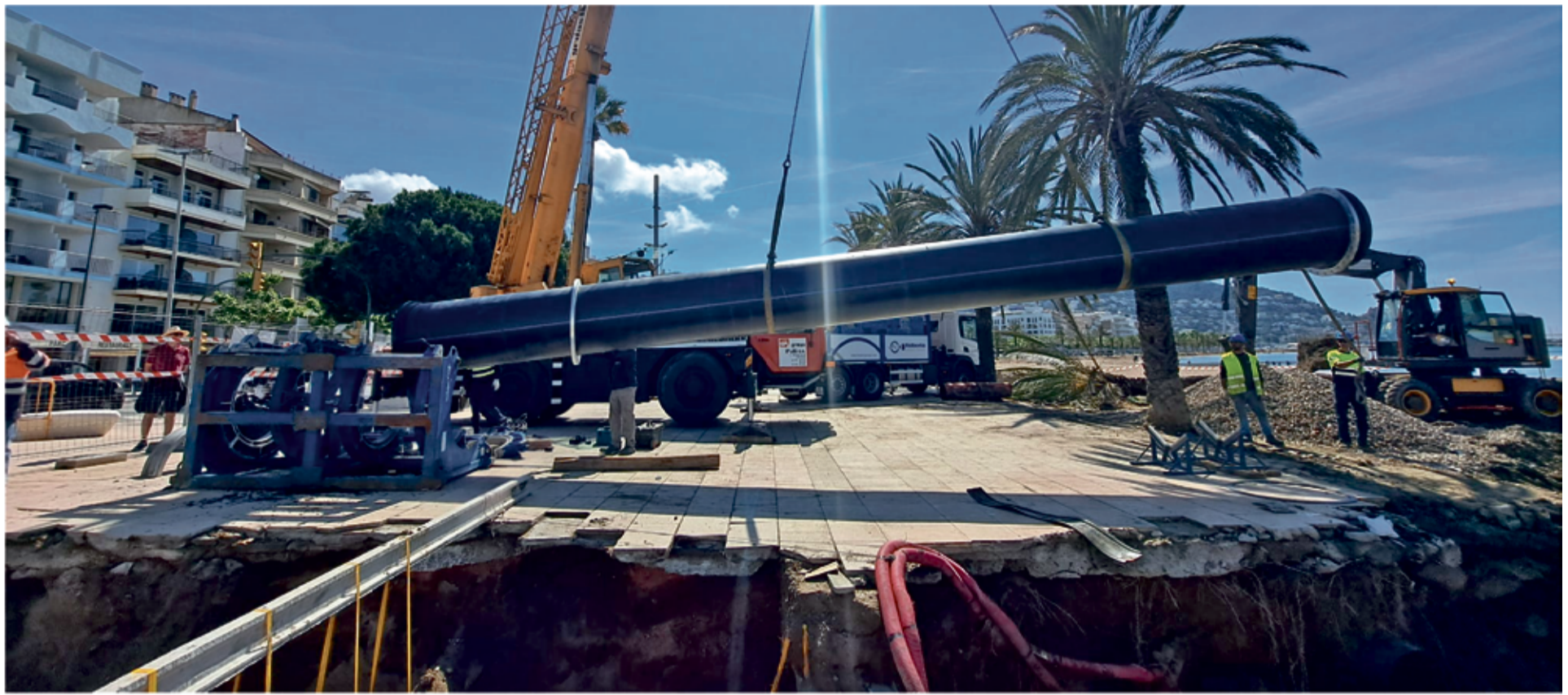
Diversos moments de l'actuació al passeig marítim de Roses