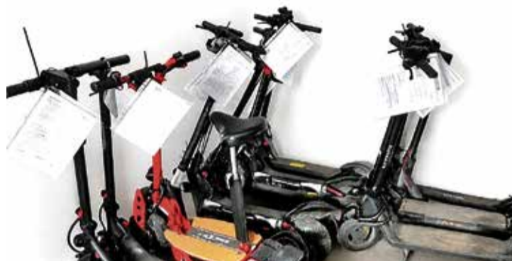
INTERVINGUTS. Per no complir la nova normativa