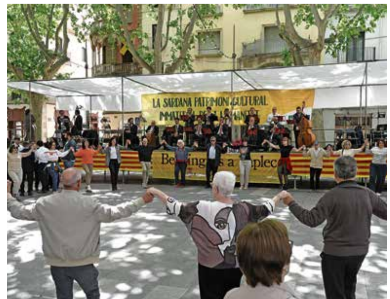
EN ACCIÓ. Sardanistes a la Rambla ÀNGEL REYNAL

L'únic que ha quedat pendent és la trobada sardanista escolar, prevista per al divendres 15 de maig, que degut a la mala climatologia s'ha ajornat fins a aquest divendres 22. La jornada manté el format amb la participació de 450 alumnes d'ESO i de Primària dels centres educatius de la ciutat, amenitzada per la cobla Vila de la Jonquera. ■