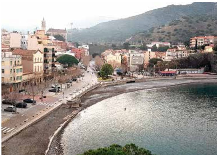
PORTBOU. Serà un dels municipis que més se'n beneficiarà

L'actuació més destacada que subvencionarà aquesta línia d'ajuts a la comarca és l'obra per construir la nova potabilitzadora a Portbou. Serà una planta que el Consorci d'Aigües de la Costa Brava farà servir per potabilitzar l'aigua de l'embassament de la riera de Portbou. Costarà 1.336.765,34 euros, i l'ACA en cobrirà 1.043.643,16.