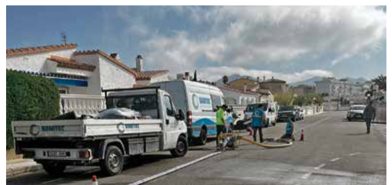
REHABILITACIÓ DEL CLAVEGUERAM. Santa Margarida i el Salatar

lectors, amb la reposició i sanejament de 217 escomeses i 69 pous de registre, la instal·lació de noves canonades de polietilè en un tram de 640 metres, les reparacions de tubs amb defectes puntuals, i la substitució de 19 pous de registre addicionals. ■