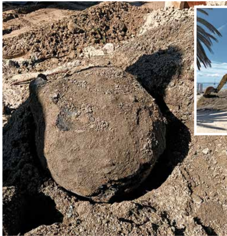
L'ARTEFACTE. La troballa va mobilitzar els TEDAX, el passat 11 de maig

La troballa es va posar al descobert en el tram final de les obres en una canonada d'aigües residuals de la platja, a l'altura de l'Oficina de Turisme. El Consorci d'Aigües Costa Brava Girona es fa càrrec d'aquesta reparació en el sistema de sanejament que va patir danys importants durant el temporal dels dies 5 i 6 de maig. En concret, es va trencar la canonada d'impulsió de l'estació de bombament d'aigües residuals (EBAR) de l'emissari submarí. ■