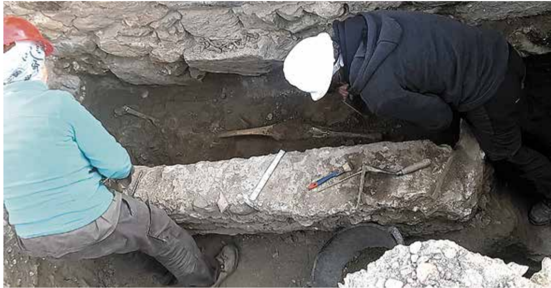
SARCÒFAG. Tècnics amb una de les tres grans descobertes de la campanya

Les excavacions han permès constatar que el complex antic tenia unes dimensions molt més grans del que es creia fins ara, arribant fins i tot més enllà dels límits que posteriorment ocuparia