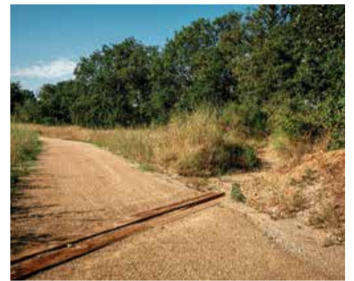
PEDRET I MARZÀ. Integració del camí de Cagarell