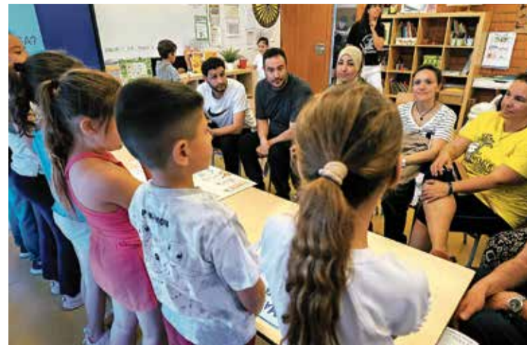
EXPOSICIÓ. Dels projectes que han treballat durant el segon trimestre

■ Amb l'objectiu d'investigar i fer propostes que promoguin la vida saludable i la sobirania alimentària, l'escola L'Amistat de Figueres ha centrat el projecte d'aquest segon trimestre a detectar els problemes del nostre entorn i pensar solucions. L'alumnat ha creat diferents projectes per fomentar el consum responsable i de proximitat, i per fer costat a la pagesia local. En aquest context, l'escola es convertirà en un punt de recollida de la Xarxa Pagesa, un col·lectiu que fa venda directa. ■