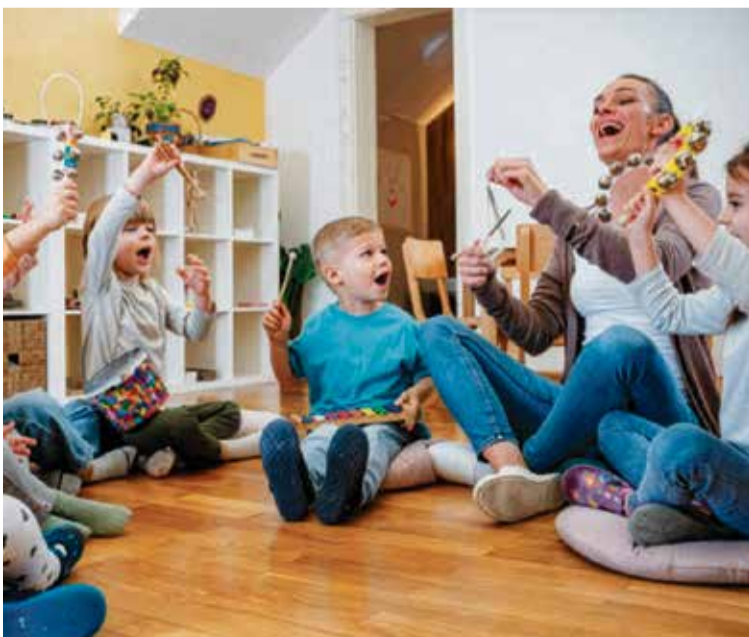
CFGM Atenció a Persones en Situació de Dependència

A més de la incorporació directa al món laboral, els alumnes que cursin aquests estudis també podran continuar el seu itinerari acadèmic cap a cicles formatius de grau superior i, posteriorment, accedir a estudis universitaris. D'aquesta manera, La Salle Figueres consolida una oferta educativa que combina especialització professional, projecció acadèmica i connexió real amb les oportunitats de futur.