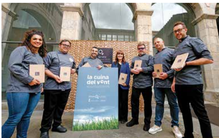
NOU COMPROMÍS. Per promocionar el segell els 365 dies de l'any