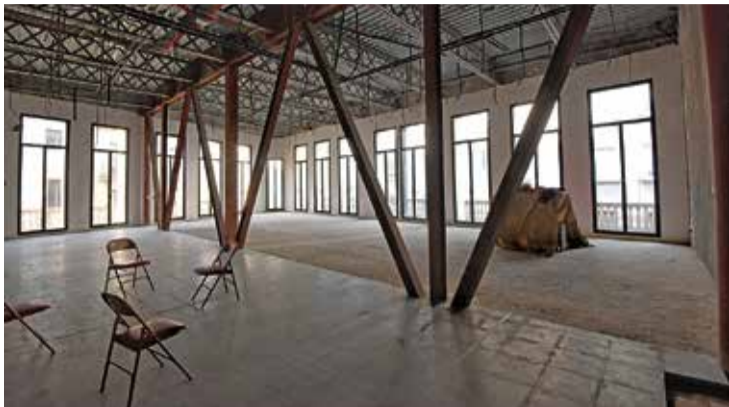
L'EDIFICI, VIST DES DE DINS. Es rehabilitarà en diverses fases ÀNGEL REYNAL