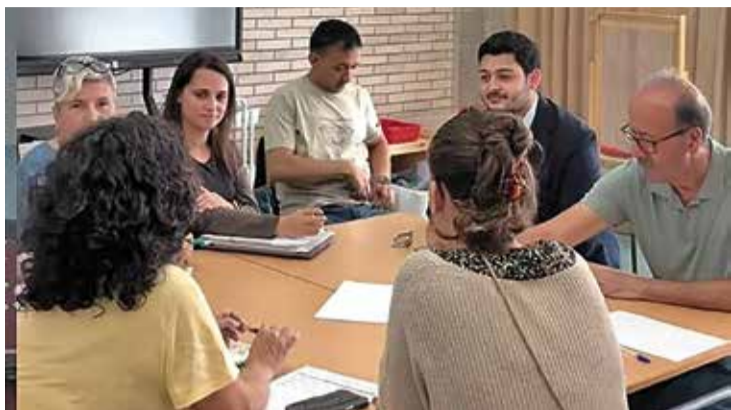
REUNIÓ. El claustre de l'escola i l'alcalde celebren l'ajut per millorar el centre AJP