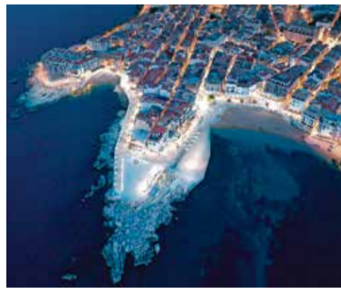
L'ESCALA. Front Marítim, fases 1, 2 i 3