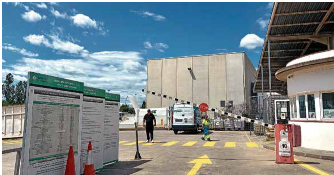
DEIXALLERIA MUNICIPAL. Les instal·lacions del carrer Itàlia, obertes de dilluns a dissabte de 8 a 19 h i diumenges de 8 a 13 h G. VISA

Els canvis s'han anat aplicat progressivament, segons expliquen els treballadors de les instal·lacions, que des de fa un any gestiona l'empresa Sersall. Amb l'adjudicació del servei, l'Ajuntament de Figueres va demanar, entre d'altres coses, reforçar el sistema de control d'accesos. En el cas del veïnat que en fa ús té sentit que es demani alguna cosa més. Amb el DNI només hi ha una identificació de la persona, però no que aquesta sigui usuària amb