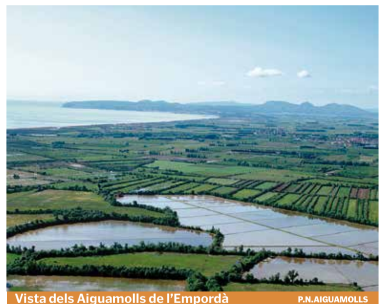
Vista dels Aiguamolls de l'Empordà

LES TORTUGUES. L'endemà, 23 de maig, es farà una sessió per descobrir les tortugues autòctones, amb l'alliberament d'exemplars recuperats. Tindrà lloc dissabte de les 10 h a les 13 h al centre d'informació Mas Matà.