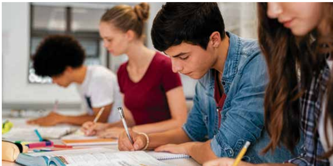
CFGM Activitats Comercials

El sector empresarial, de fet, no només participa en l'acollida d'alumnes en pràctiques, sinó que també col·labora activament en l'organització i desenvolupament dels cicles formatius. Empreses i professionals del territori han contribuït a definir els continguts, les competències i les metodologies de treball amb l'objectiu de formar perfils professionals adaptats a les necessitats reals del mercat laboral. Aquesta implicació direc-