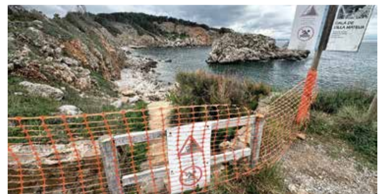
ILLA MATEUA. Actualment té l'accés restringit per risc de desprendiments AJ.L'ESCALA