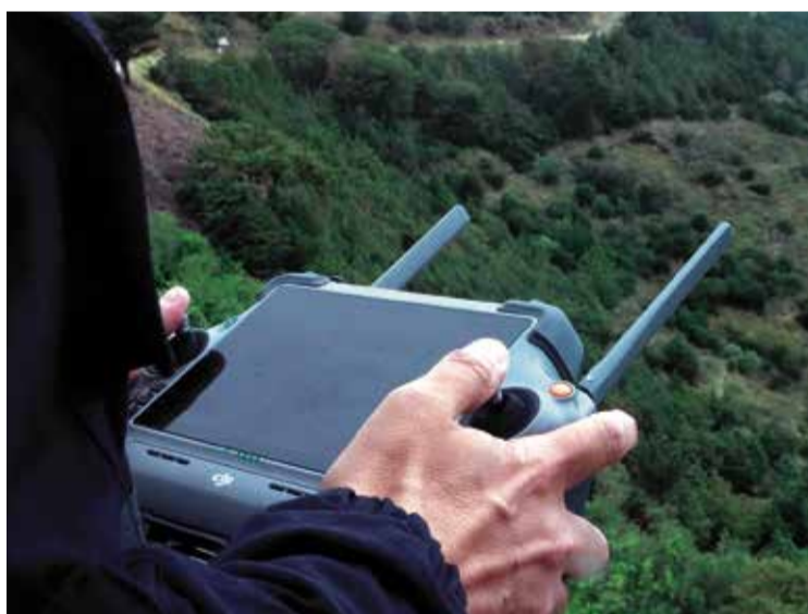
VIGILÀNCIA AMB DRONS. Sobrevolaran els camins secundaris

«El que volem és reforçar i fer més eficaç el nostre sistema de control de la frontera», diu el prefecte. I en concret sobre la immigració «clandestina» i el narcotràfic. «Que el tràfic de drogues