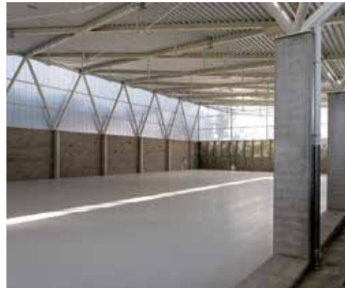
FIGUERES. Cinquena façana (pista esportiva coberta)