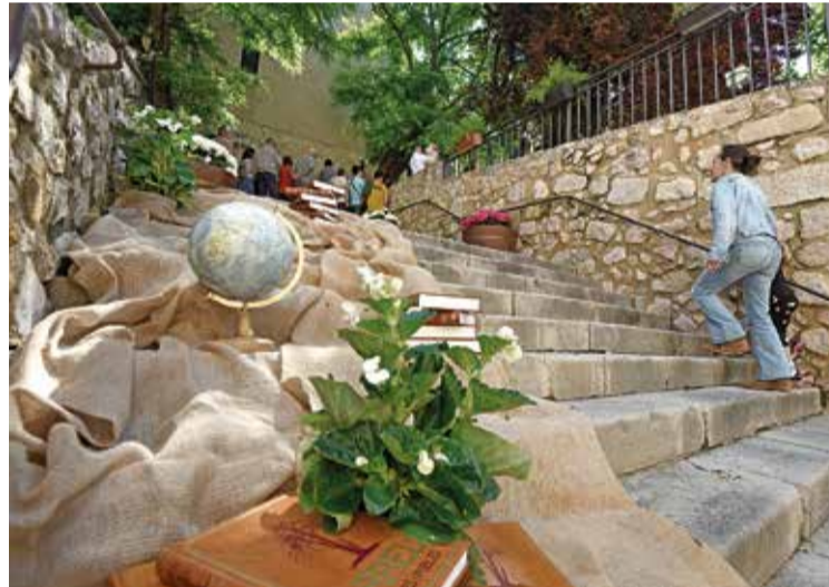
LA LLAVOR. El municipi ha exhibit decoracions dedicades a l'escola ÀNGEL REYNAL

Els carrers de Vilanant s'han convertit aquest cap de setmana en un espai de festa, memòria i tradició amb motiu de la Firaflor 2026. Un any més, el municipi s'ha engalanat i omplert de flora i color per celebrar l'arribada de la primavera. Carrers i places han lluit decoracions de flors i plantes tematitzades, entre les quals han destacat especialment les disposicions florals dedicades a l'escola del municipi, protagonista de la festa d'enguany, tal com indicava el lema de la celebració: «La llavor de l'escola». Combinacions de pupitres i girasols amb una pissarra de fons o les plantes sorgint de la terra com les generacions del municipi que han florit al centre educatiu han estat les decoracions més especials de la fira d'enguany.