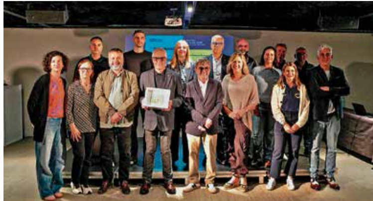
DIVENDRES. Cloenda amb conclusions sobre el futur del turisme

Durant l'acte, el president de l'Associació d'Empresaris Roses -