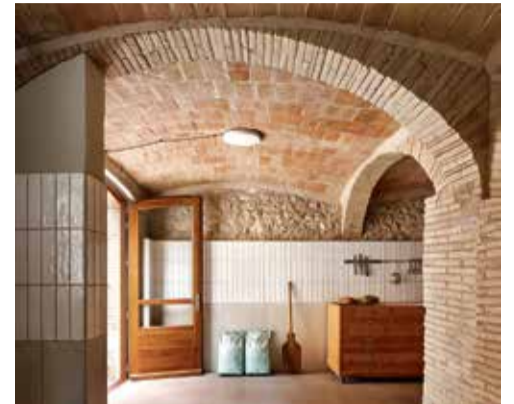
AVINYONET DE PUIGVENTÓS. Forn Lleva't