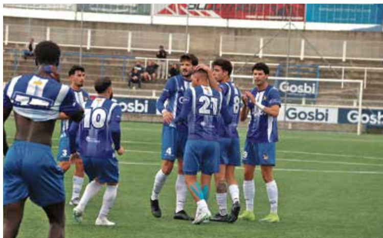
IGUALTAT. El partit, poc lluit, va acabar amb unes taules justes