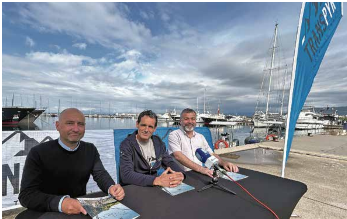
ACTE DE PRESENTACIÓ. Va tenir lloc la setmana passada al port de Roses

Amb el calendari a la mà, la setena edició donarà el tret de sor-