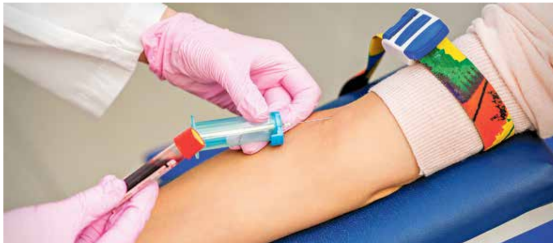
EN ACCIÓ. La campanya cerca aconseguir 10.000 donacions

PRINCIPALS RECEPTORS. El Banc de Sang i Teixits calcula que al