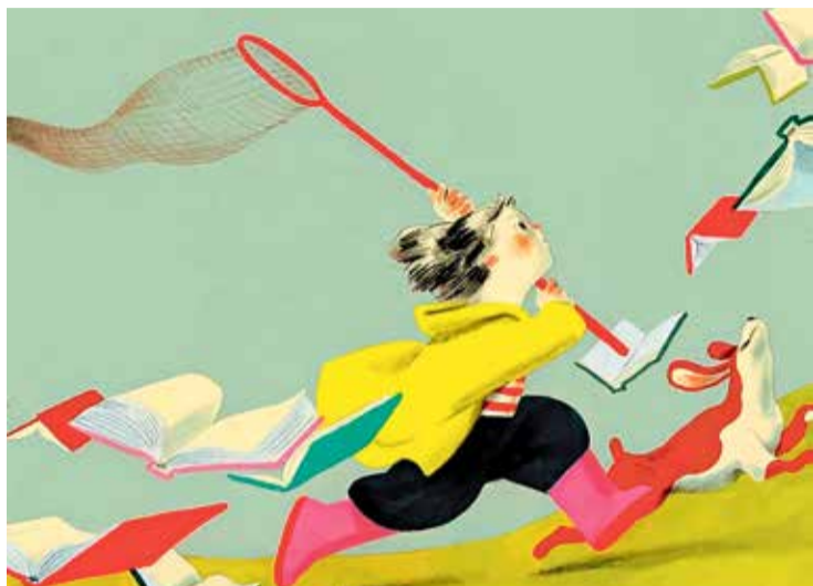
PREMIAT. Un dels dissenys premiats de Torrent