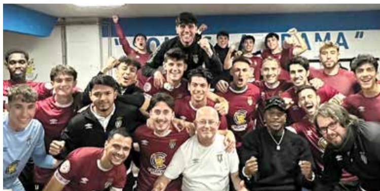
PERALADA. El bloc xampanyer celebrant la victòria a domicili

■ El Peralada ha tornat de les vacances de Nadal amb bona forma. Ho va evidenciar el cap de setmana passat al Municipal Nou de Santa Coloma de Gramenet, on va vèncer el conjunt local per la mínima (0-1). El partit va ser equilibrat, amb ocasions per a tots els dos conjunts, i la igualtat es va haver de trencar des del punt de penal: Busquets va ser l'autor del