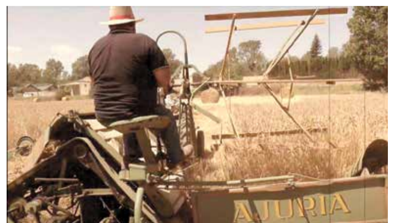
EL PAGÈS DE FERRO. El poble cerca el millor agricultor

Ferro, una competició divertida i emocionant on es posaran a prova les habilitats rurals dels participants, a través de petits reptes on seran importants la tècnica i la força i també l'ús del tractor. El repte està previst per a diumenge a les 10 del matí i tothom que hi vulgui participar s'hi pot inscriure in situ 30 minuts abans de l'inici davant de la sala polivalent. ■