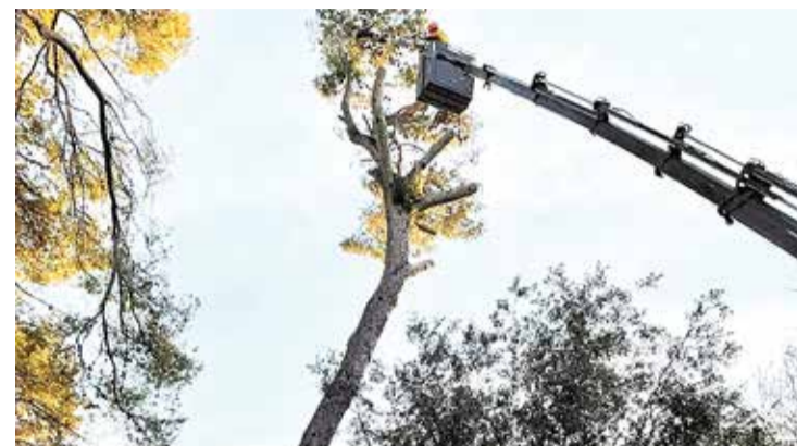
EN PROCÉS. Els operaris treballen des de divendres