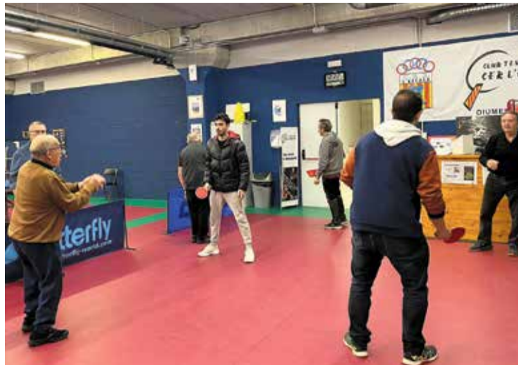
EN ACCIÓ. Primera sessió a la sala polivalent de l'Escala