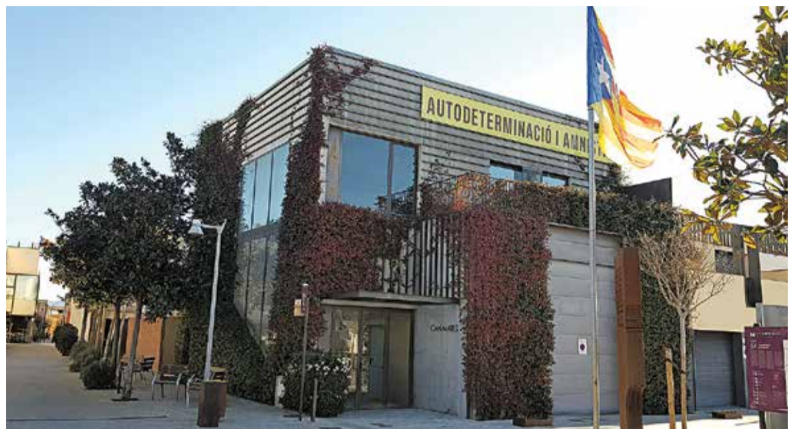
CAN MATES. Aquest any s'acabarà d'adequar el primer pis de l'edifici, on s'habilitarà una sala polivalent

Enguany el consistori té previst destinar uns 100.000 euros a comprar finques. En aquest sentit, Brugat matisa que «hem adquirit dues finques i n'adquirem una tercera per a reestructuració de pàrquings». Les dues que ja tenen emparaulades són la que la família Cervilla té al xamfrà del carrer dels Prats, que també disposa d'una altra partida de 48.000 euros per convertir la zona en un gran solar, i els 2.160 m 2 de l'hort de Can Toral que donen accés al