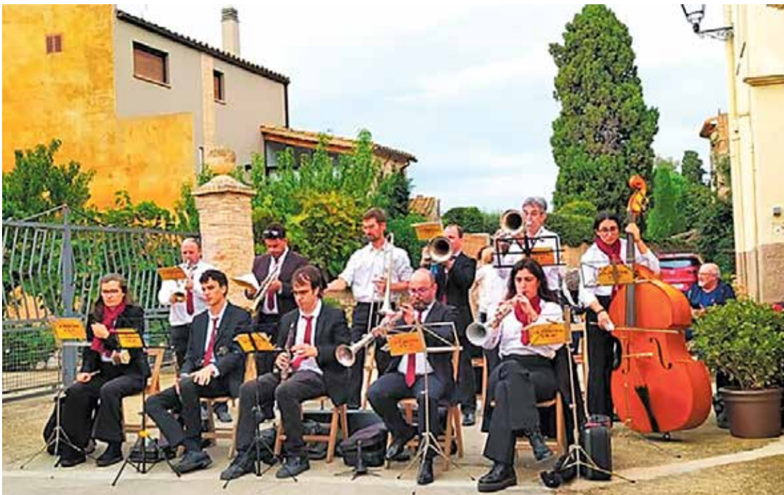
La cobla La Principal d'Olot amenitzarà els actes de diumenge al matí