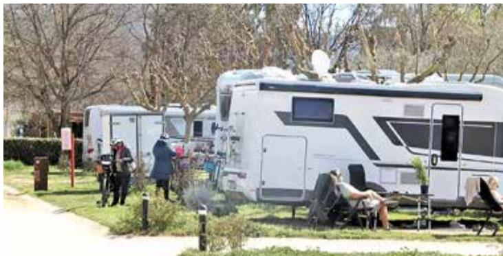
TENDÈNCIA. Els càmpings locals augmenten les reserves fora de l'estiu