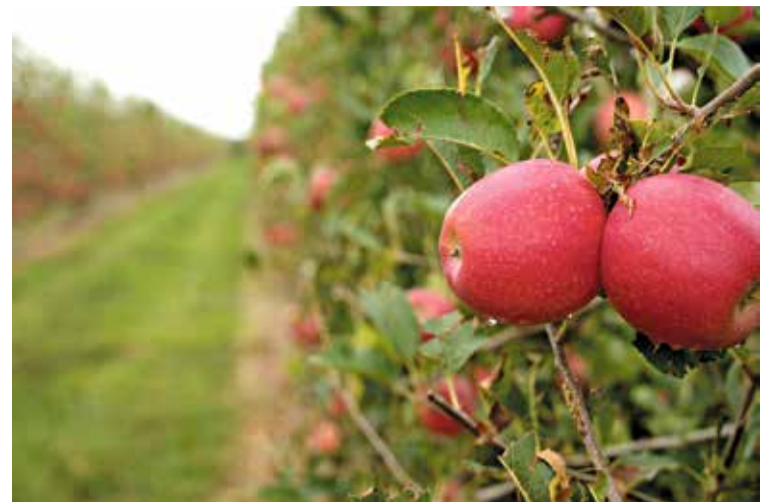
LA VARIETAT. Originària d'Itàlia, fa pocs anys que fusiona la Gala i la Pink Rose HN

Aquesta varietat de poma, dolça i cruixent, és capaç d'adaptar-se a diferents climes i altituds. Té origen a Itàlia i es va crear fa pocs anys fruit de la investigació en combinar les varietats Gala i Pink Rose. El 2020 Fructícola Empordà va entrar a formar part del club europeu de Tessa, una organització que gestiona la producció i comercialització de la varietat perquè es compleixin uns estàndards de qualitat i que té poc més d'una desena de socis repartits pel continent. Aleshores van començar un pla pilot per observar com s'habitua la poma a la climatologia i al terreny de Sant Pere Pescador, i els resultats van ser positius, tot i trobar-se al ni-