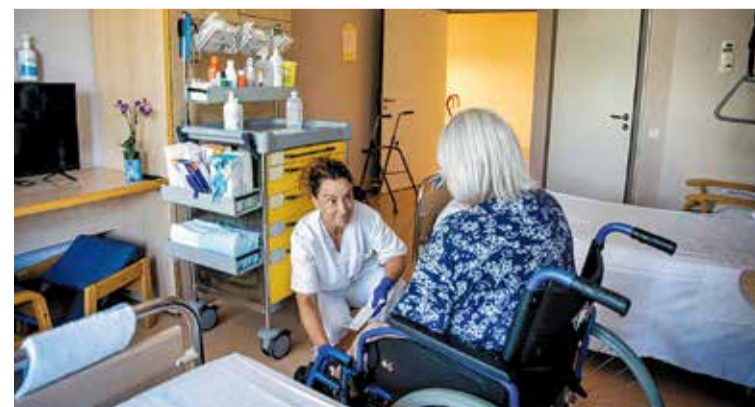
ATENCIÓ INTEGRAL. A les persones grans i als seus cuidadors

■ El Departament de Salut ha canviat el nom del que fins ara era el Centre Sociosanitari Bernat Jaume, que s'ha passat a dir Hospital d'Atenció Intermèdia (HAI). El rebateig s'emmarca en l'impuls que volen donar a l'HAI, entès com el conjunt de recursos sanitaris temporals que ajuden a millorar l'autonomia de persones a qui els han minvat les capacitats per causa de malaltia o accident. ■