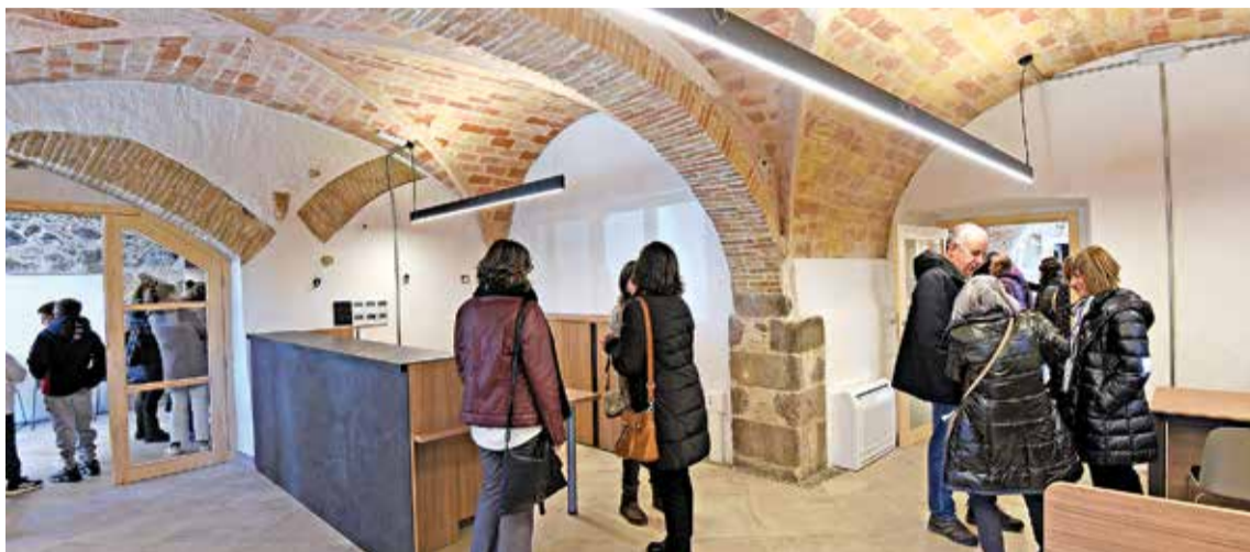
AQUEST DIUMENGE. Portes obertes l'edifici de la Casa Gran que serà la nova ubicació de l'Ajuntament