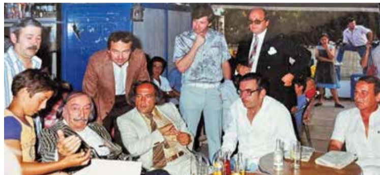
ANYS 70. Dalí al Boia, que també van freqüentar Pla, Duchamp i altres il·lustres BOIA

'ALGÚ VA RECLAMAR'. La legislació de costes no permet que dos locals arran de mar estiguin a una distància menor de 150 metres. I el Boia és a menys de 20 metres