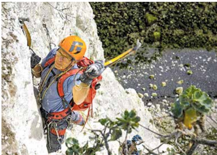
MICK FOWLER. L'escalador i alpinista britànic serà un dels grans protagonistes

■ La 24a edició de La Mostra Muntanya i Aventura, organitzada pel Centre Excursionista Empordanès (CEE), ja escalfa motors per desplegar-se entre els dies 17 i 25 de gener. L'esdeveniment, que combina conferències, projeccions i activitats culturals al voltant del món de la muntanya, es va presentar oficialment el passat 15 de novembre al saló del Cercle Sport Figuerenc, on es van donar a conèixer els grans noms que formaran part d'aquesta edició. Entre els quals crida l'atenció el del reconegut escalador i alpinista Mick Fowler, guanyador en tres ocasions del prestigiós Piolet d'Or. «És un dels plats forts, sí. Representa aquest alpinisme d'exploració i compromís, un alpinisme que s'enfila a cares descon-