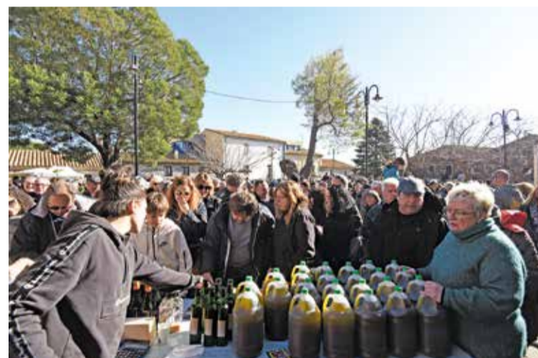
Les parades es repartiran pels carrers del poble À. REYNAL

La 28a edició de la Fira de l'Oli i l'Olivera, prevista per aquest diumenge (dia 19), omplirà Espolla d'activitats durant tot el cap de setmana. I és que malgrat que la fira comercial amb els trullaires de la comarca es farà diumenge (també inclourà venda de planter, productes, eines i maquinària referents a l'oli i l'olivera, i fira d'artesans i elaboradors de l'Albera), la programació començarà dissabte. I ho farà amb la caminada a la Gutina (punt de trobada a les 10 h al camp de futbol), una visita i tast al Celler Cooperatiu d'Espolla (16 h, amb reserva), una xerrada sobre els efectes medicinals de les fulles d'olivera i ullastre (17 h, al Sindicat), el taller per aprendre el «Ball de l'Oli» (19 h, al Sindicat) i la representació teatral Taxi d'El Traster Teatre de Fontcoberta (21.30 h, a La Fraternal).