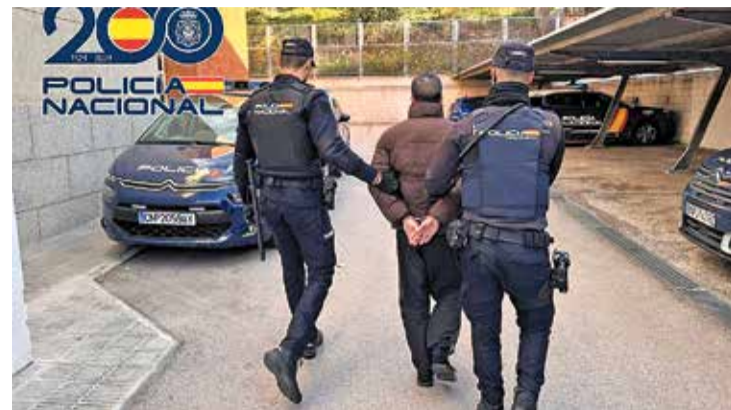
EL DETINGUT. En un dels enviaments intentava introduir 50 kg de cànnabis