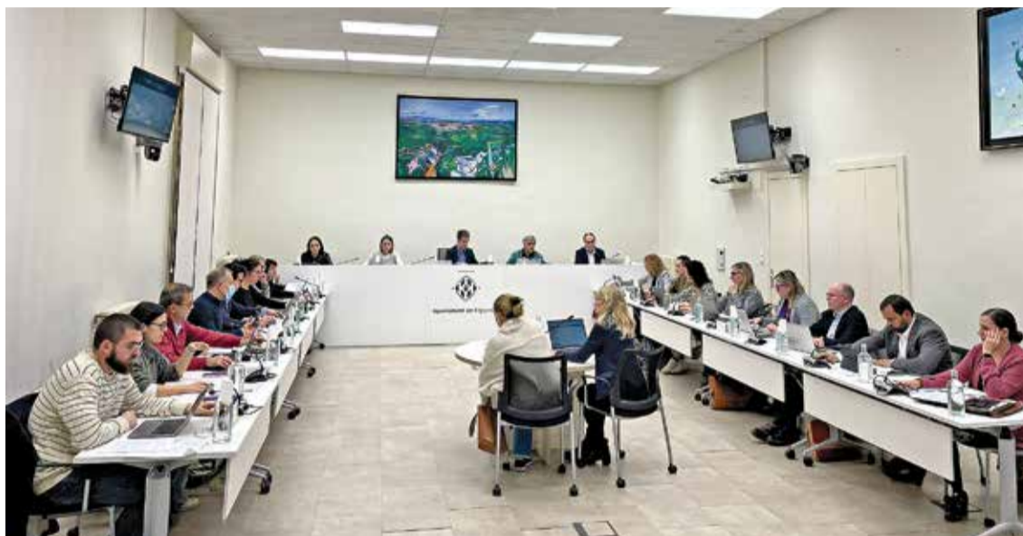
LA SESSIÓ. Es va fer dijous de la setmana passada, un cop acabades les festes nadalenques

En contestar-li, Masquef va admetre que «ha pujat la delinqüència, i així ho reflecteixen les dades», però va afegir que «som un dels municipis de la província on menys ha pujat». «Podem estar orgullosos d'aquestes dades? No, en absolut, perquè hem d'aspirar a millorar-les i a intentar revertir la situació. I què s'està fent? Doncs manllevo paraules seves del discurs d'investidura nostra, que comparteixo plenament: la Guàrdia Urbana no només ha d'estar per mirar taules i cadires, i para-sols, sinó que ha de donar un servei exemplar i, sobretot, ho ha de fer no en dependències municipals, sinó al carrer», va reblar.