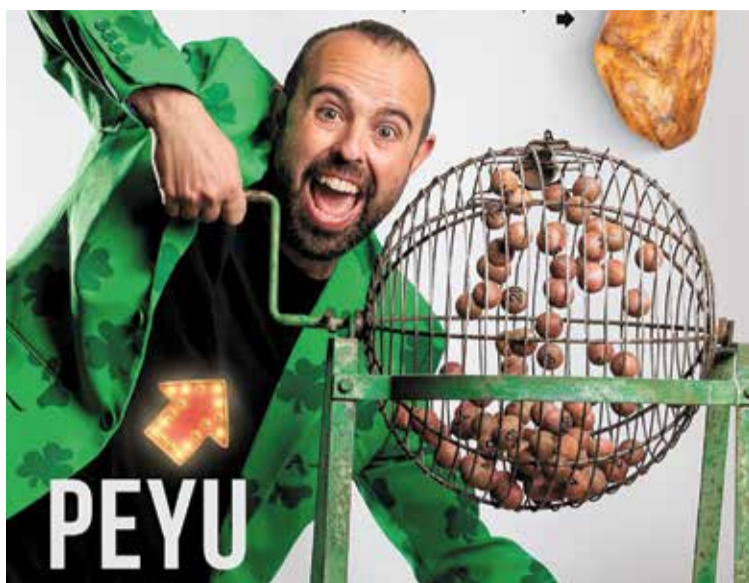
En Peyu representarà 'La niña bonita' EL CORRAL

L'Ajuntament de Llançà, amb la col·laboració de diverses entitats del municipi, ha programat cinc dies d'activitats per a tots els públics per celebrar la seva festa major d'hivern, en honor a Sant Vicenç. El lliurament de la Beca Coll-Alcocer, que es farà divendres a les 17.30 h a la sala de plens, donarà el tret de sortida a gairebé una setmana de gresca i xerinxola. I el mateix divendres també s'inaugurarà l'exposició «La mirada fructífera» (dels alumnes del taller de pintura del Casal de la Gent Gran) a la Casa de Cultura, i se celebrarà la Ktatonik Fest VII a l'envelat (20 h). Hi