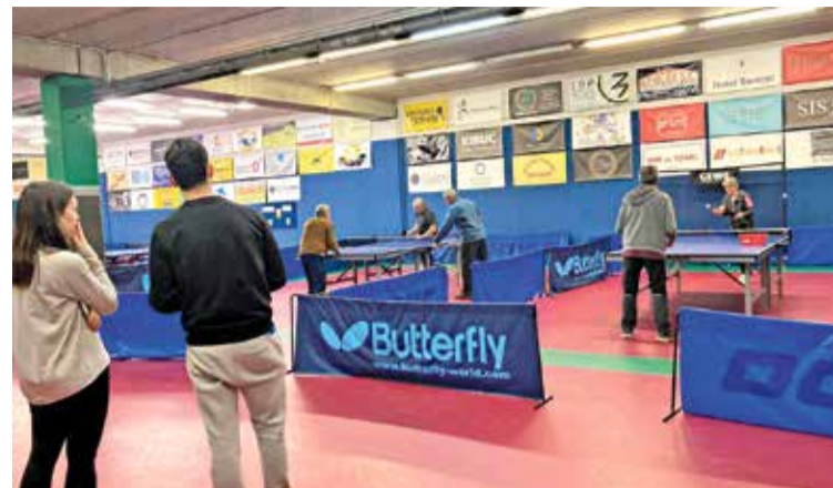
INICI. La primera sessió es va fer el 9 de gener a la sala polivalent