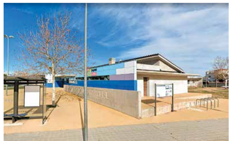
ESPAI ALBERES. És un dels punts on s'ofereix el servei, junt amb El Centro HN

En aquest sentit, dues monitors dinamitzaran aquests punts i donaran suport als joves en les