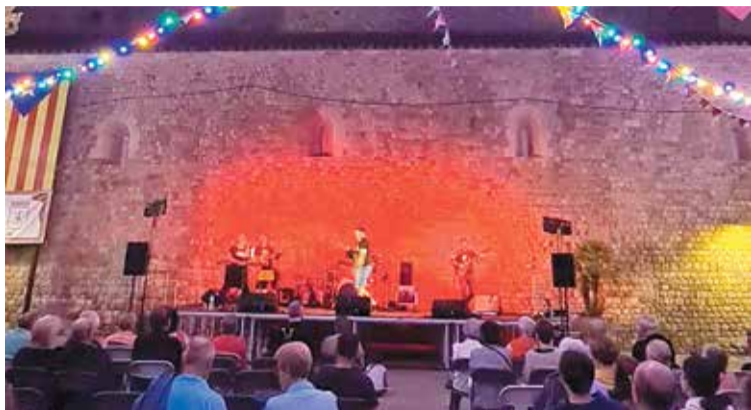
EXTERIOR. Un dels concerts a la plaça del darrer estiu