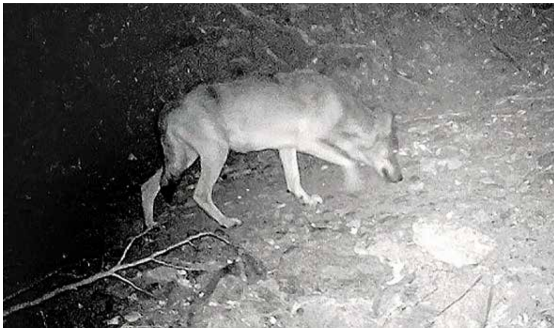
EL LLOP TORNA A CASA. Va marxar de Catalunya fa 100 anys i ara arriba des d'Itàlia i ocupant França

Actualment l'excés de segons quin tipus de fauna genera problemes, ja sigui afectant la sinistralitat a les carreteres o malmetent cultius. Sargatal parla de l'experiència que estan tenint en altres indrets amb llops, com ara els Alps Marítims. Els caçadors d'aquelles zones ja s'han començat «a queixar» perquè el senglar ha baixat un 30% i el cabirol,