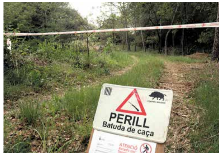
MÉS CELERITAT. Els pagesos demanen tràmits més àgils per matar senglars

Cada vegada més pagesos s'apunten als cursos per treure's el permís d'armes i així poder matar i protegir els seus camps dels atacs dels animals. ■