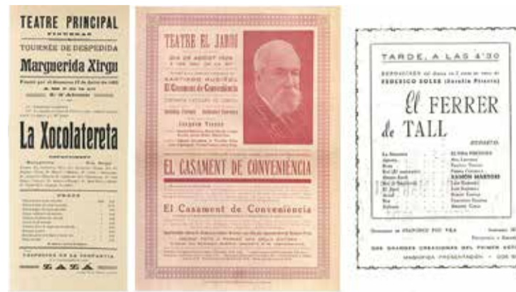
PROGRAMES. Recull de propostes escèniques del segle passat