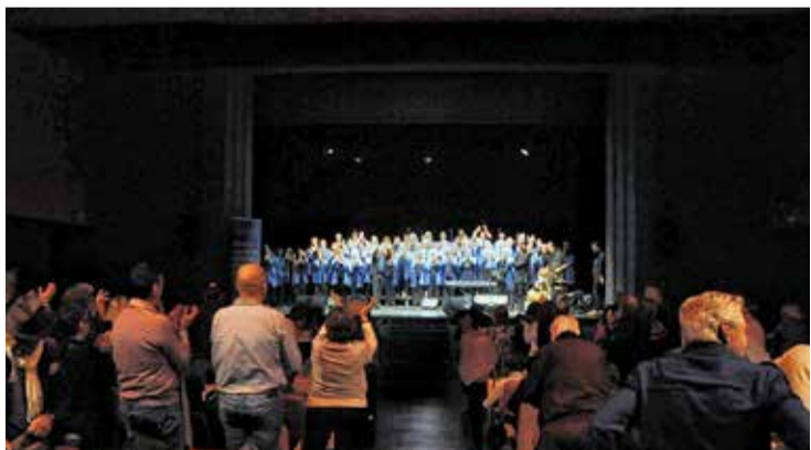
GÒSPEL SOLIDARI. Setanta cantaires que van fer elevar els cors