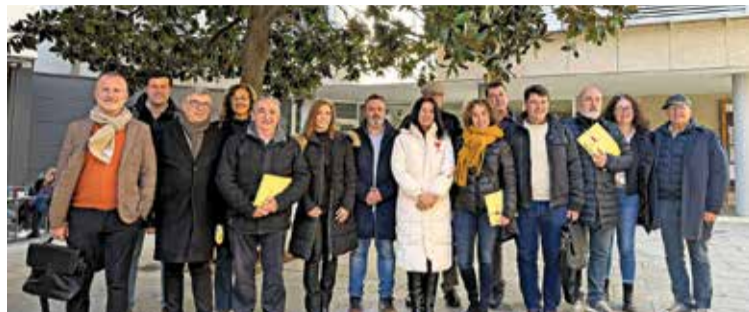
GRUPS DEL GOVERN. Reunits dissabte a Llançà per la reunió de treball

Altres qüestions del pla són: la incorporació de noves competències i promoure la implicació amb projectes com l'Avinguda del Vi i de l'Oli o la posada en valor del patrimoni de pedra seca.