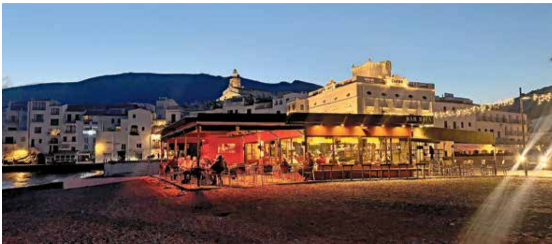
A PEU DE LA PLATJA GRAN. El Boia, inaugurat el 1946, va ser un referent cultural i el 2012 es va convertir en cocteleria d'autor BOIA