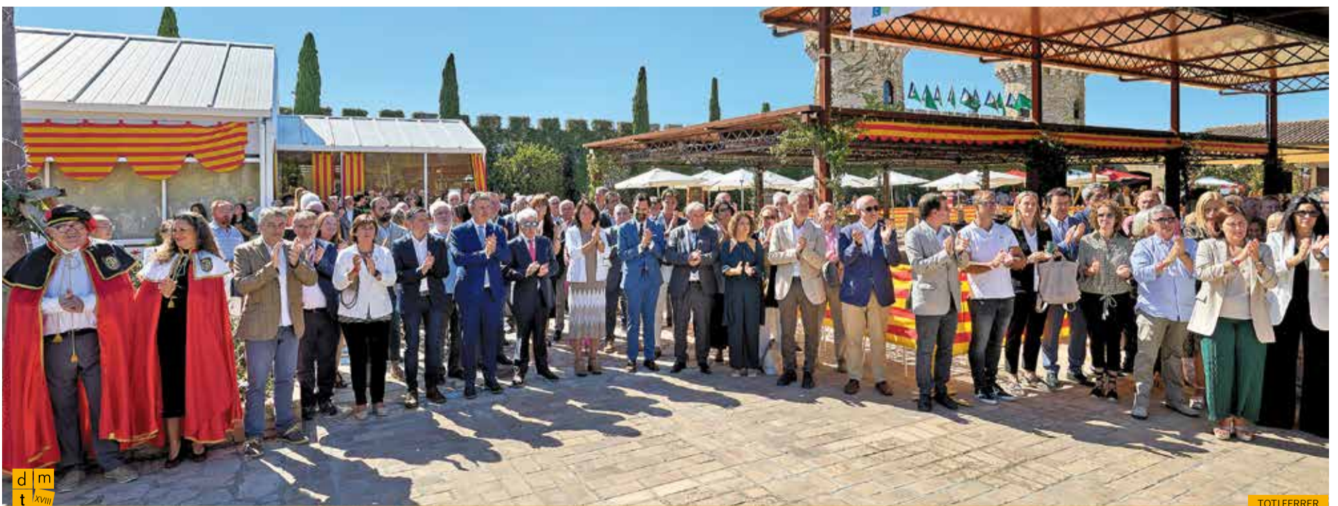
Salutació a la bandera catalana