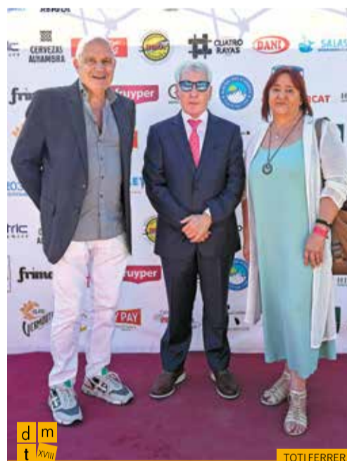
El president i la directora de PIMEC Comerç amb el president de la Federació