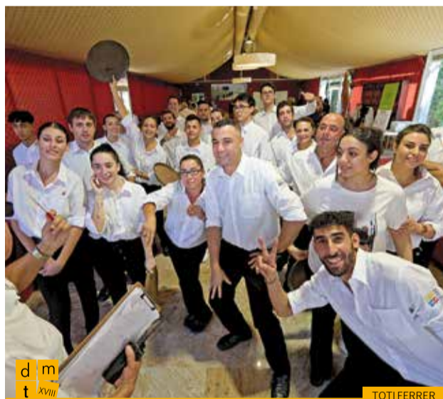
Equip de cambrers i cambreres que van servir l'àpat