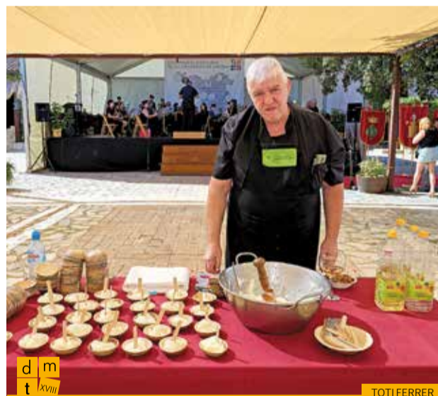
Taula de preparació de l'allioli de Morter