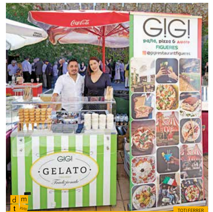
Estand de gelats GIGI