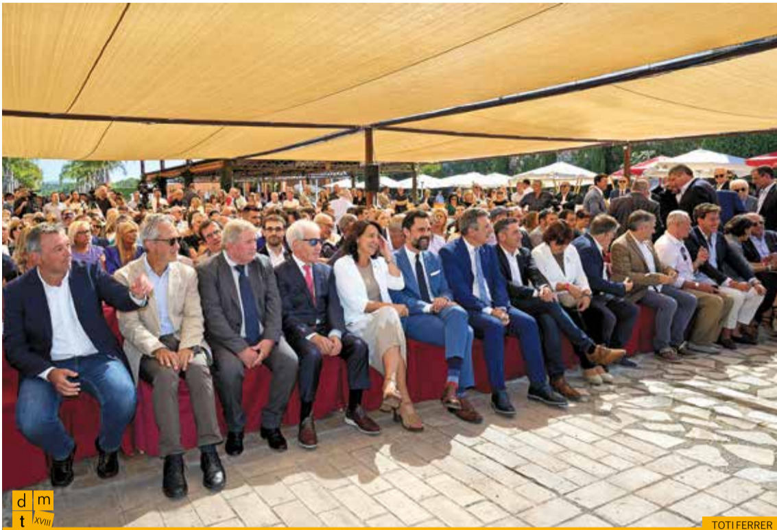
Primera fila d'autoritats