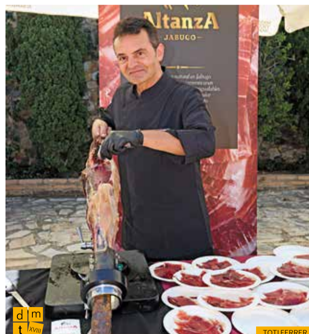
Estand de pernil ibèric Altanza