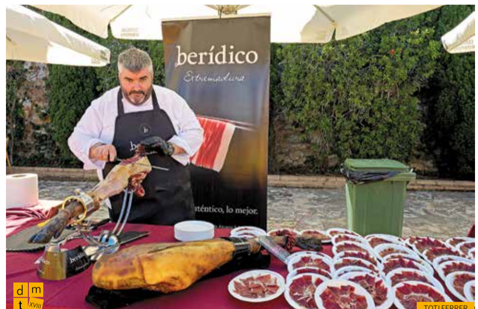
Estand de pernil ibèric Berídico - Ilunion Azuaga