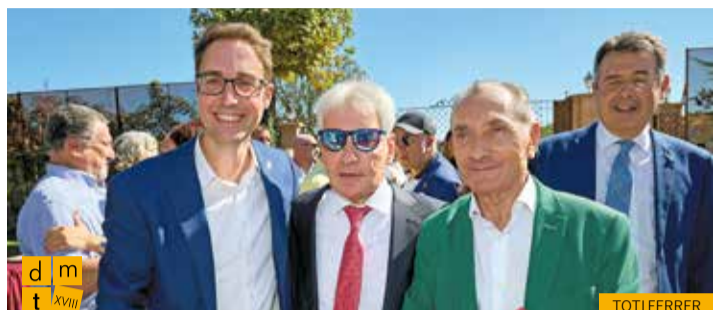
L'alcalde de Figueres i el cap de gabinet de la Diputació de Girona amb el president de la Federació

En aquesta divuitena edició del Dia Mundial del Turisme s'hi van tornar a reunir més de 800 persones, entre empreses associades a les onze associacions que formen la Federació, proveïdors del sector de l'hostaleria, representants de patronals i institucions empresarials de la província de Girona, autoritats representants de la Generalitat de Catalunya i de l'Estat espanyol, i alcaldes i alcaldesses dels municipis de les comarques gironines.