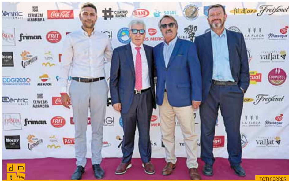
CEO i treballadors de l'assessoria Grup Simon amb el president de la Federació