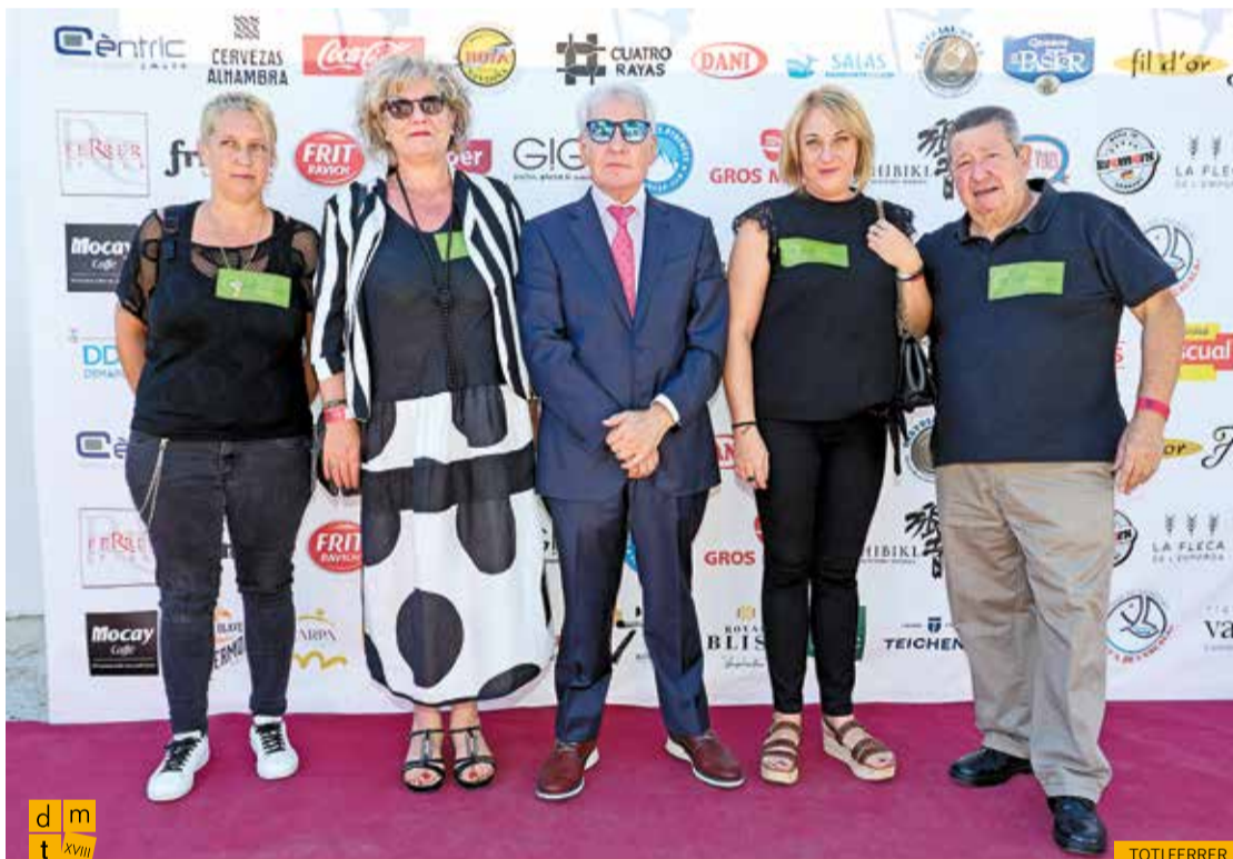
Membres de la junta directiva de l'Associació d'Hostaleria de la Selva amb el president de la Federació