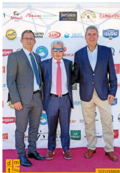
El comissari en cap de la Policia Nacional a Girona amb el president de la Federació