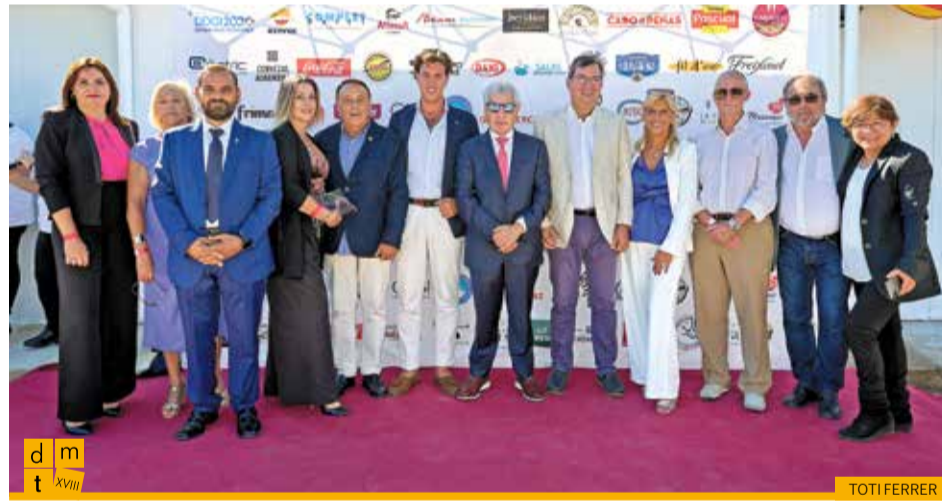
Diputat al Parlament de Catalunya de Vox i regidors de la mateixa formació amb el president de la Federació