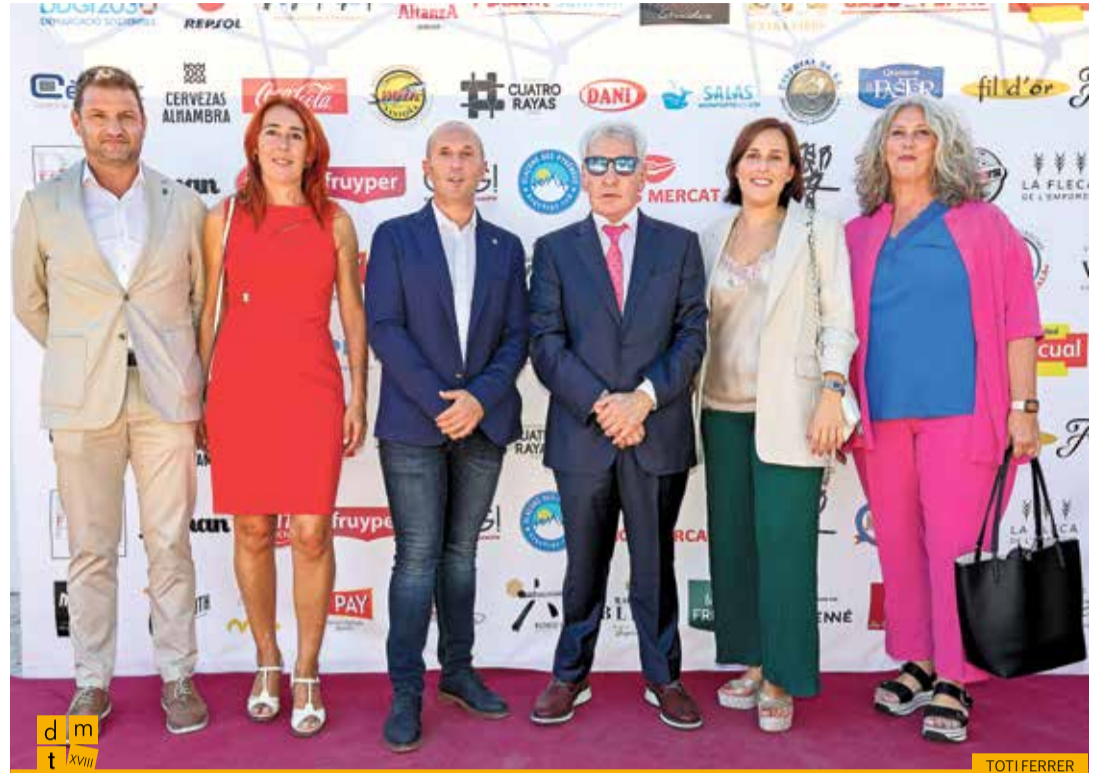
L'alcalde, l'equip de govern i l'exalcalde de la Jonquera amb el president de la Federació