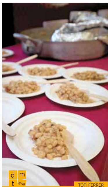
Fesols de Santa Pau amb carn de perol