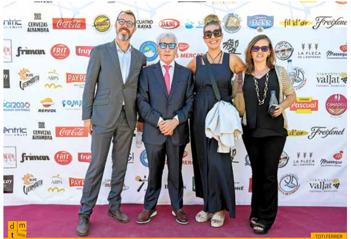
Representants del Banc Sabadell a Girona amb el president de la Federació