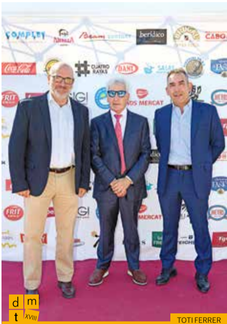
El coronel i cap del Regiment Arapiles 62 i el subdelegat de Defensa amb el president de la Federació