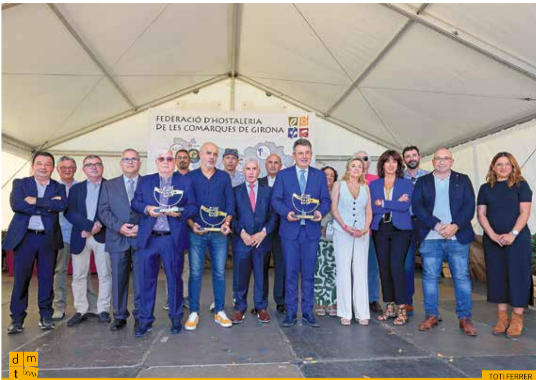
Moment de l'entrega dels reconeixements