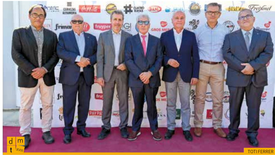
El president, el vicepresident, el director i membres del ple de la Cambra de Comerç de Girona amb el president de la Federació