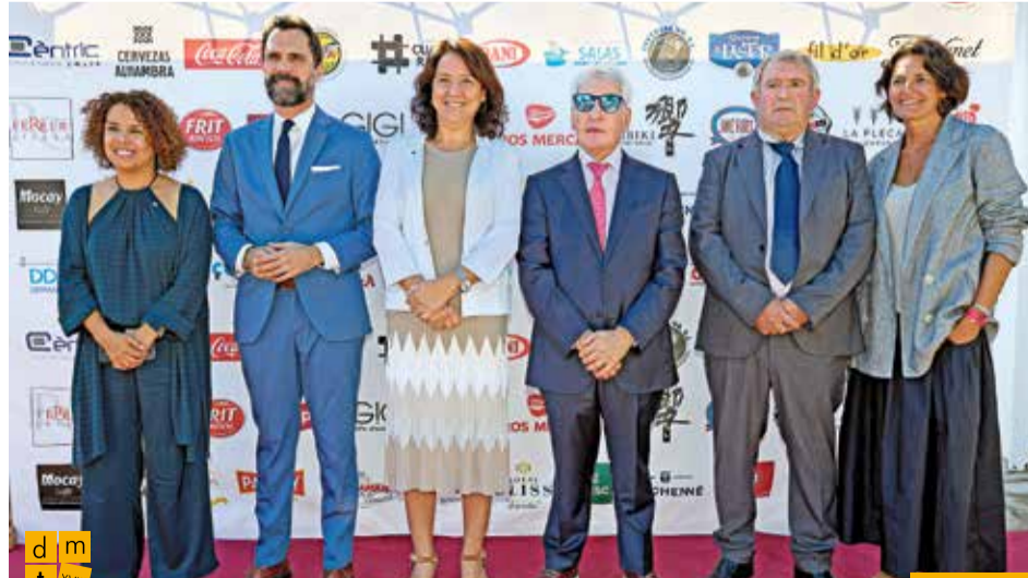
D'esquerra a dreta: la delegada del govern a Girona, el conseller d'Empresa i Treball, la presidenta del Parlament de Catalunya, el president de la Federació, l'alcalde de Masarac i la directora general de Turisme