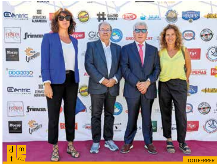
La presidenta i membres de la junta directiva de l'Associació d'Apartaments Turístics de Girona