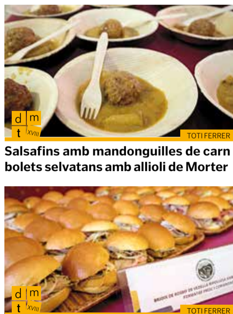
Brioix de rosbif de vedella ripollesa amb ceba tendra, formatge fresc i coriandre