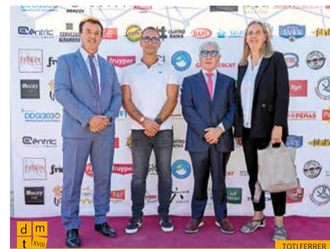
D'esquerra a dreta: el sotscap de l'ABP de l'Alt Empordà, el sotscap de la Regió Policial de Girona, el president de la Federació i la cap de la Regió Policial de Girona dels Mossos d'Esquadra