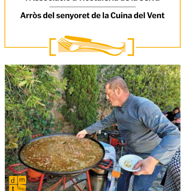
Arròs del senyoret