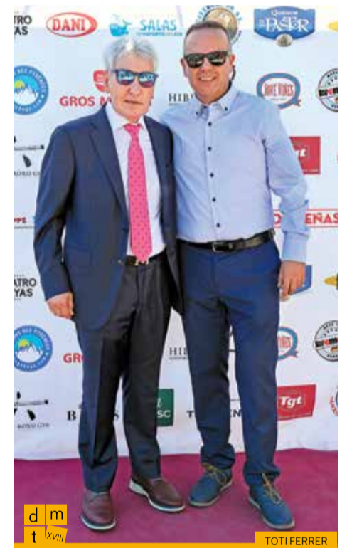
Regidor de Tots per La Jonquera de l'Ajuntament de la Jonquera amb el president de la Federació