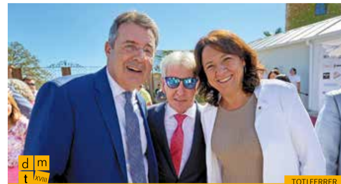
La presidenta del Parlament de Catalunya i el president de la Diputació de Girona amb el president de la Federació