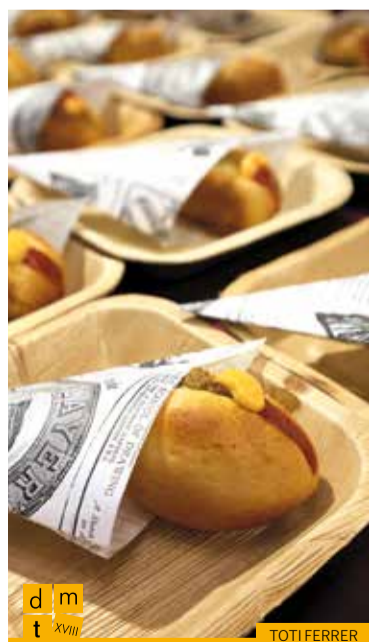
Brioix de pollastre amb gambes i maionesa de nyora