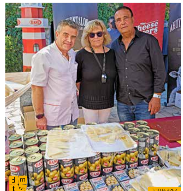
Estand de formatges Quesos el Pastor i TGT