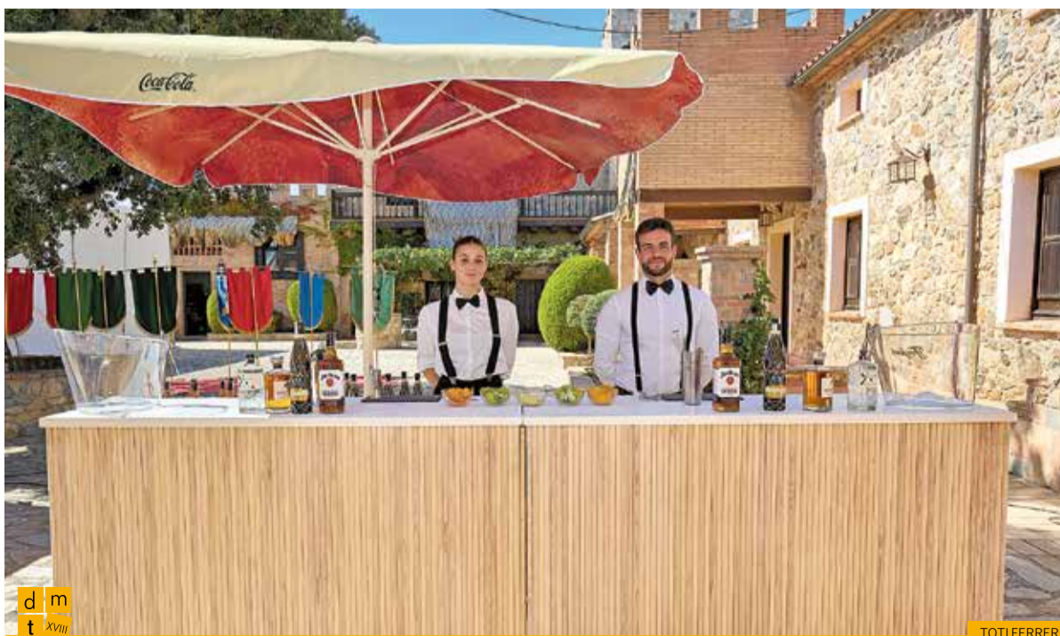
Barra de Beam Suntory