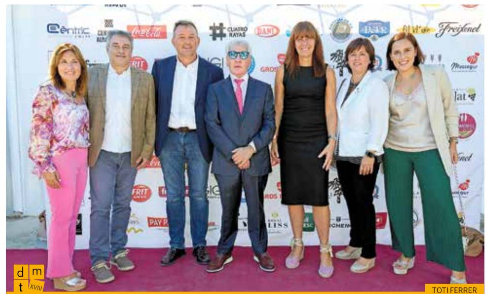
D'esquerra a dreta: vicepresidenta segona de la Diputació de Girona, diputat al Parlament de Catalunya per Junts per Catalunya, diputat al Congrés per Junts per Catalunya, el president de la Federació, diputada al Congrés per Junts per Catalunya, vicepresidenta de la Comissió d'Empresa i Treball del Parlament i l'alcalde de la Jonquera