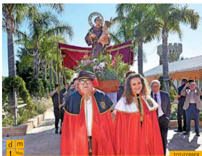
Processó de Sant Antoni de Pàdua encapçalada pels vescomtes de Biart

Anaya va anunciar a tots els assistents que el motiu pel qual es feia l'actuació de la vescomtessa era l'homenatge a la societat francesa que en l'edició del Dia Mundial del Turisme de l'any 2016 es va dur a terme com a mostra de suport als atemptats que van patir. I per la qual cosa es va col·locar l'escultura del mapa francès davant de la bandera.