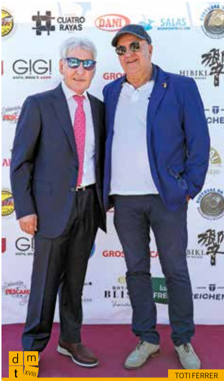
L'alcalde de Capmany amb el president de la Federació