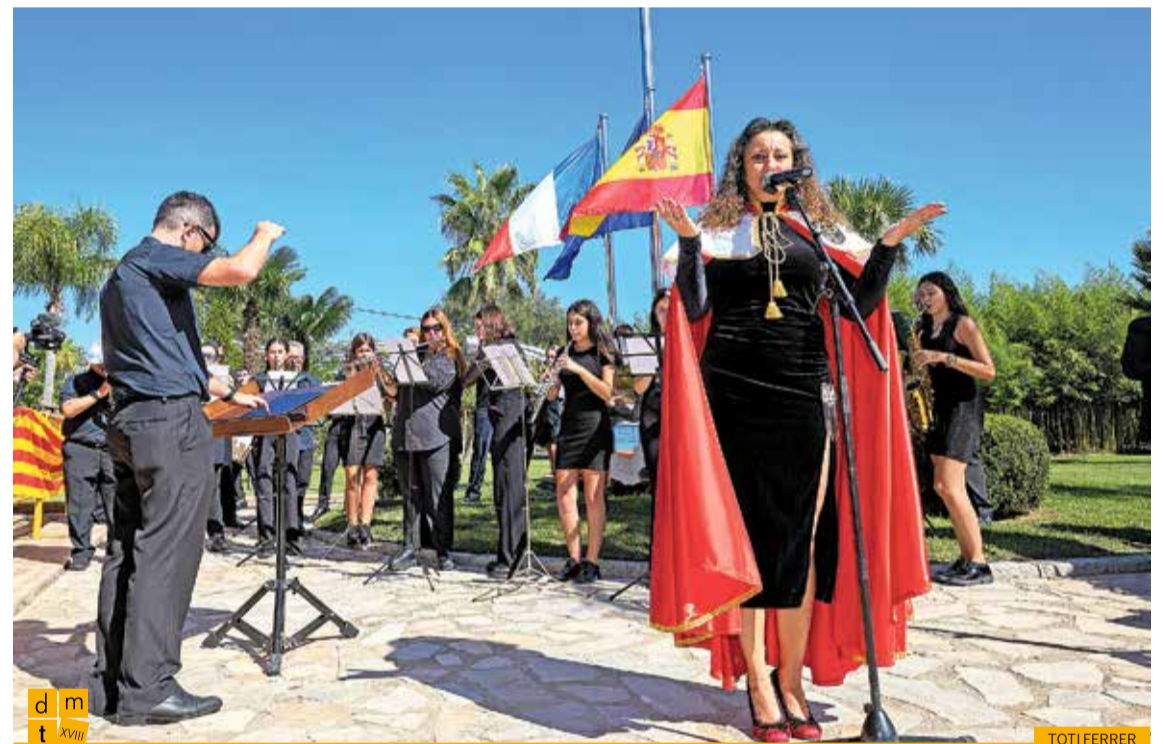
Interpretació de la cançó l'Hymne à l'amour