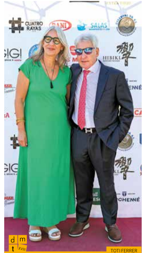
La presidenta de l'Associació d'Empresàries Gironines amb el president de la Federació