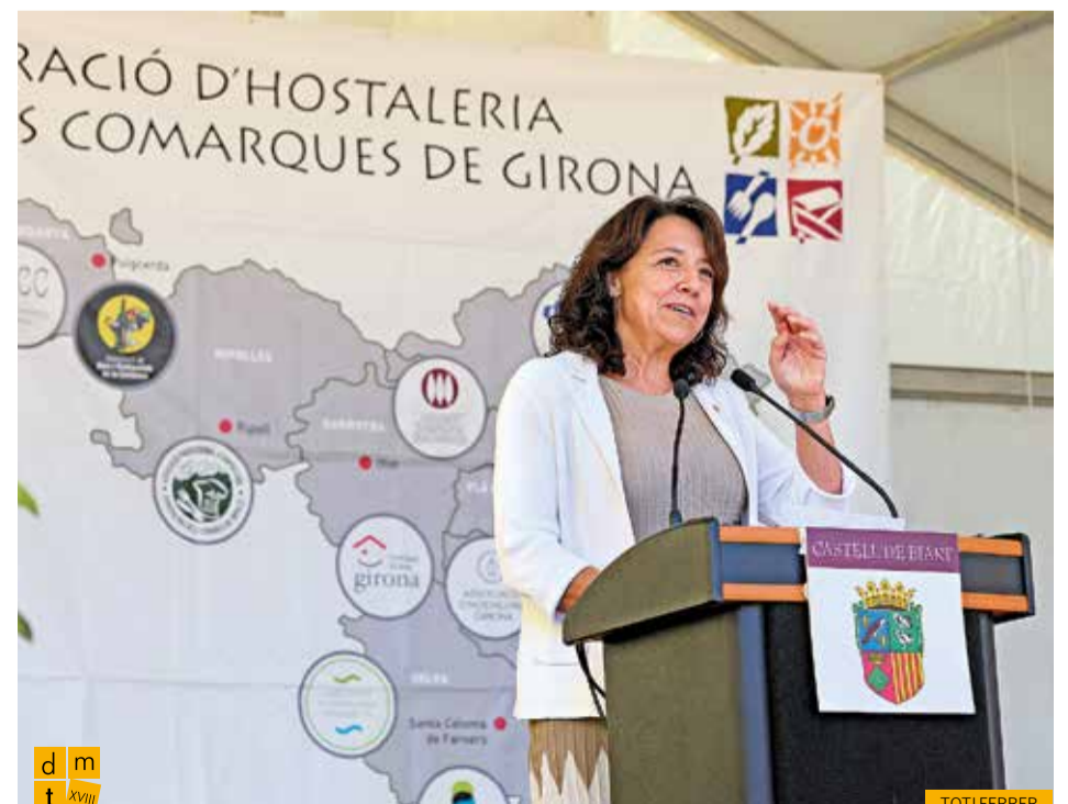
Discurs de la presidenta del Parlament de Catalunya, Anna Erra