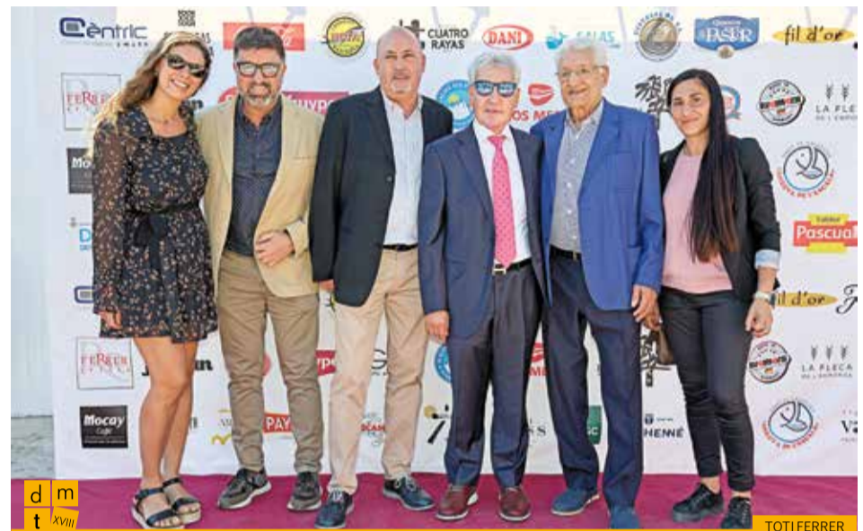
President i treballadors de l'empresa Frit Ravich amb el president de la Federació