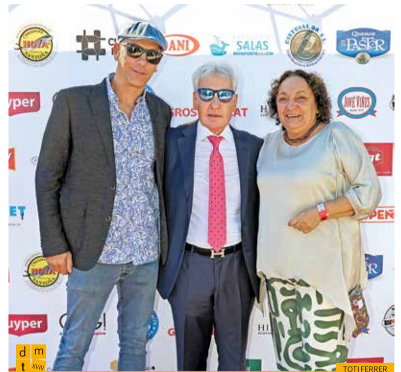
El president de l'Associació d'Hostaleria del Ripollès i la presidenta de l'Associació de Bars i Restaurants de la Cerdanya amb el president de la Federació