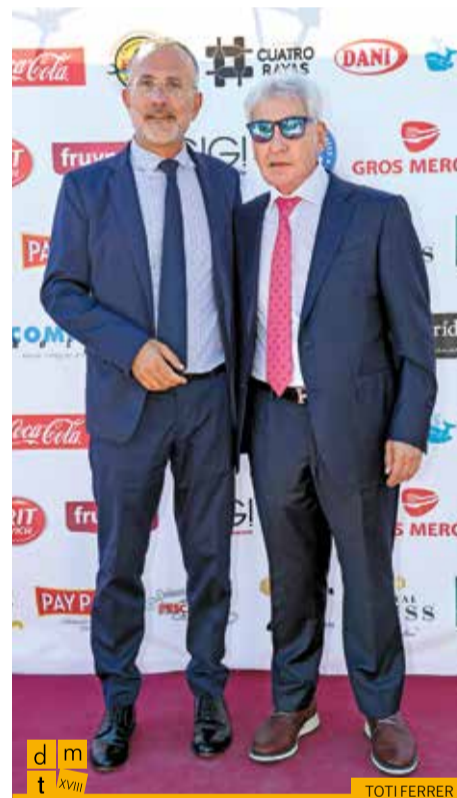
Regidor del PSC de l'Ajuntament de Figueres amb el president de la Federació