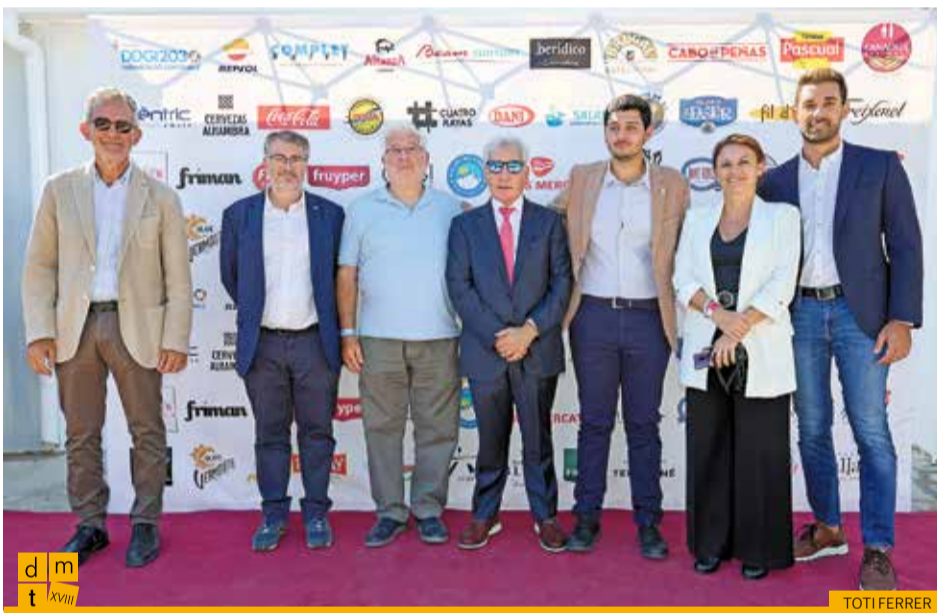
D'esquerra a dreta: subdelegat del govern a Girona, diputat al Parlament de Catalunya pel PSC, senador pel PSC, alcalde de Portbou, regidora i regidor del PSC