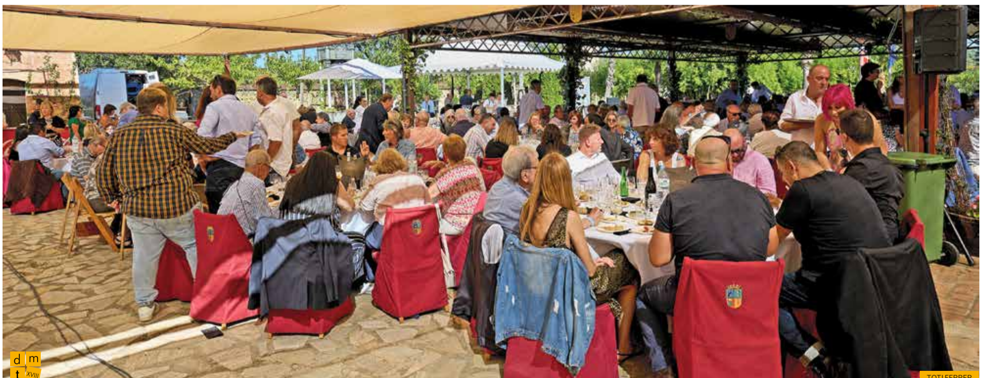
Convidats degustant el dinar