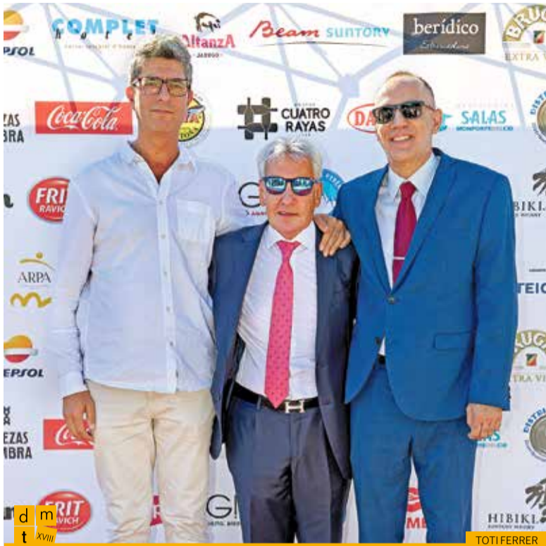
Representants de Distrial 98 amb el president de la Federació