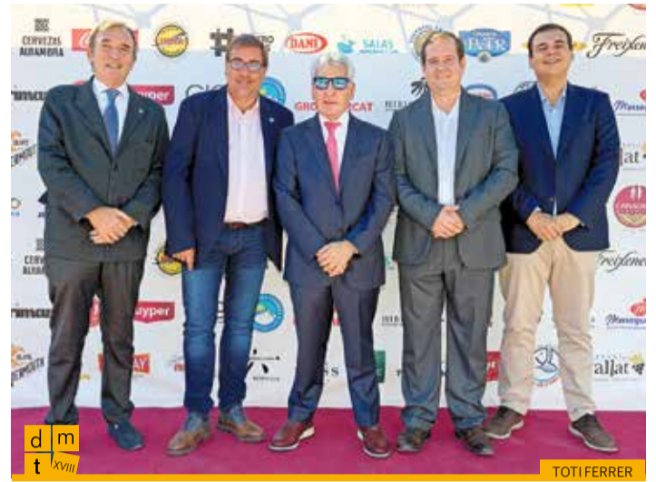
El president i equip del Partit Popular a Girona amb el president de la Federació