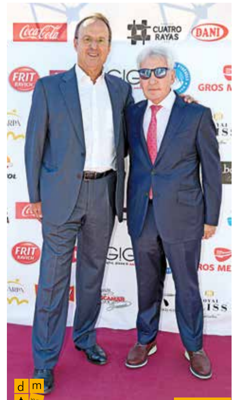
El president de la Fundació Altem amb el president de la Federació