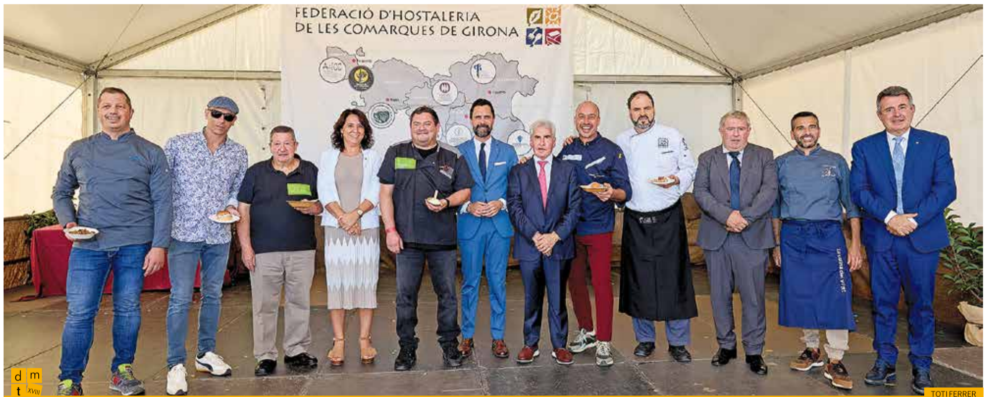
Presentació dels cuiners dels col·lectius gastronòmics i els seus tastets damunt de l'escenari

En aquesta edició els col·lectius participants van ser l'Associació d'Hostaleria del Ripollès, l'Associació d'Hostaleria de la Selva, la Cuina de l'Empordanet, la Cuina del Vent i la Cuina Volcànica.