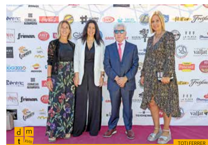
L'alcaldessa i regidores de l'Ajuntament de Llançà amb el president de la Federació