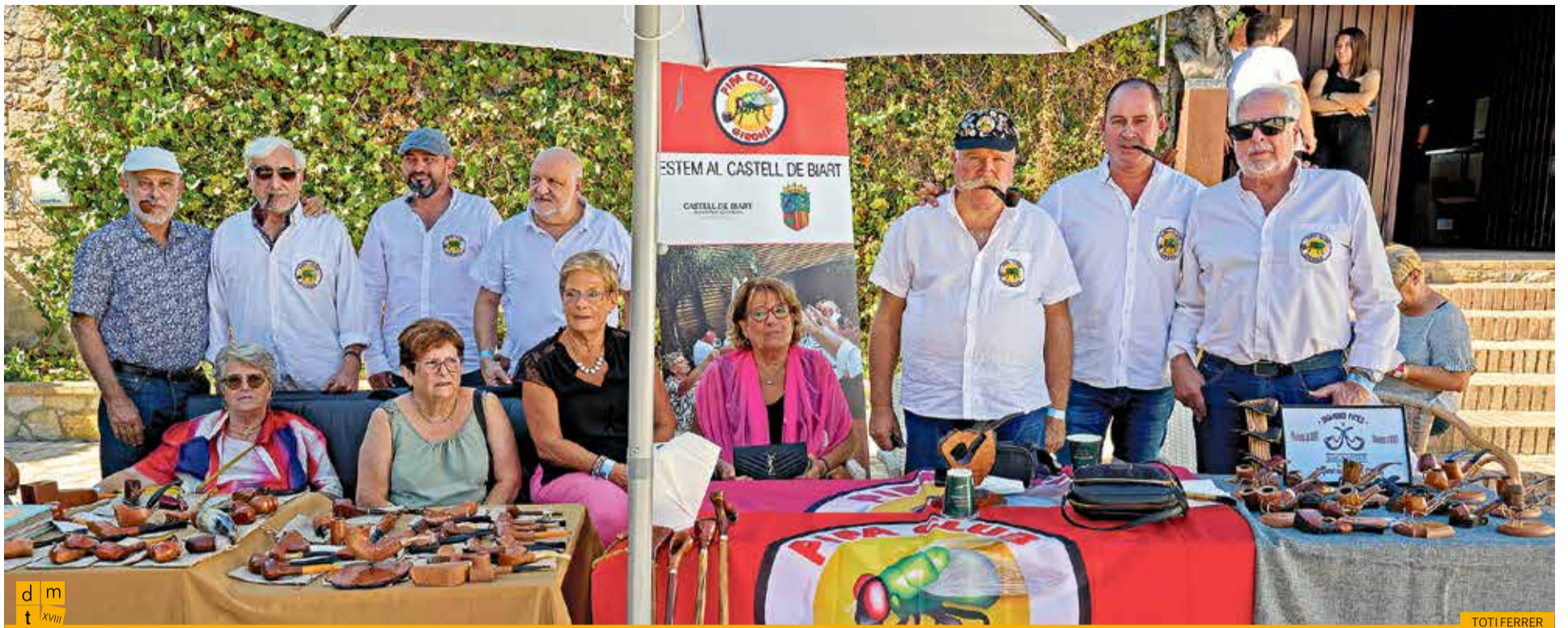
Estand del Girona Pipa Club