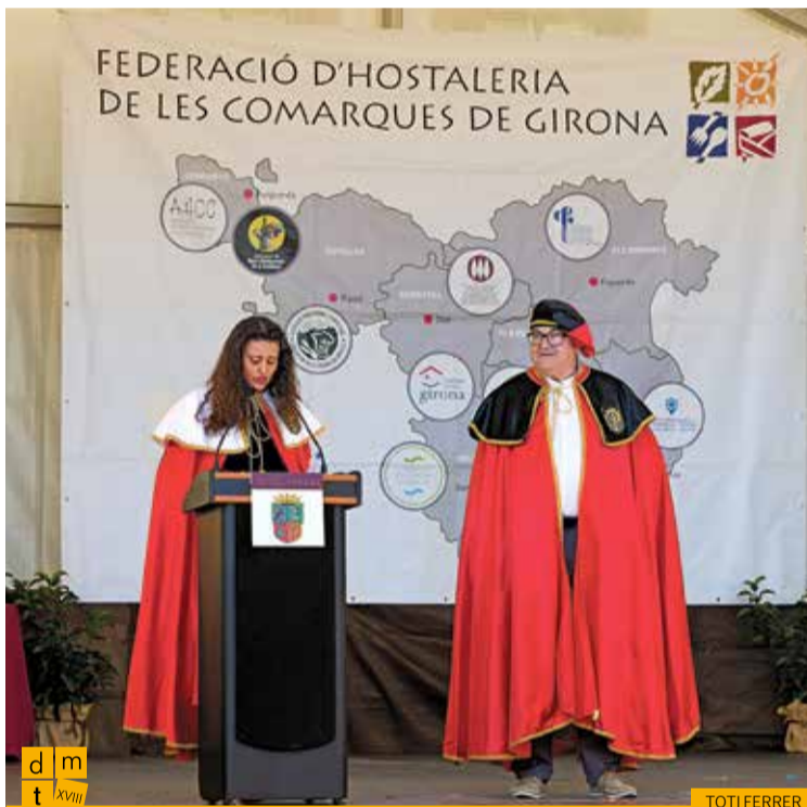
Benvinguda dels nous vescomtes de Biart