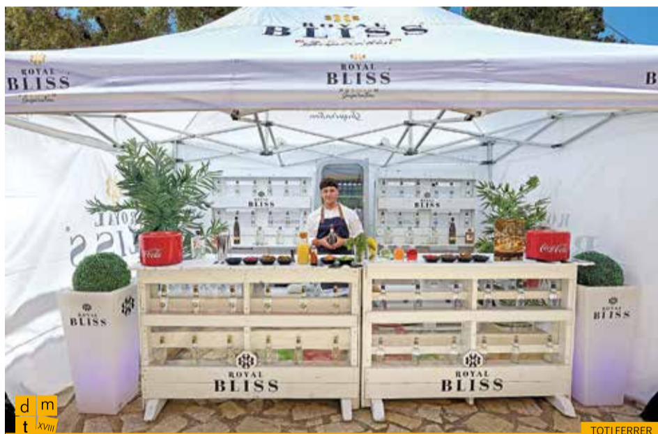
Barra de Royal Bliss