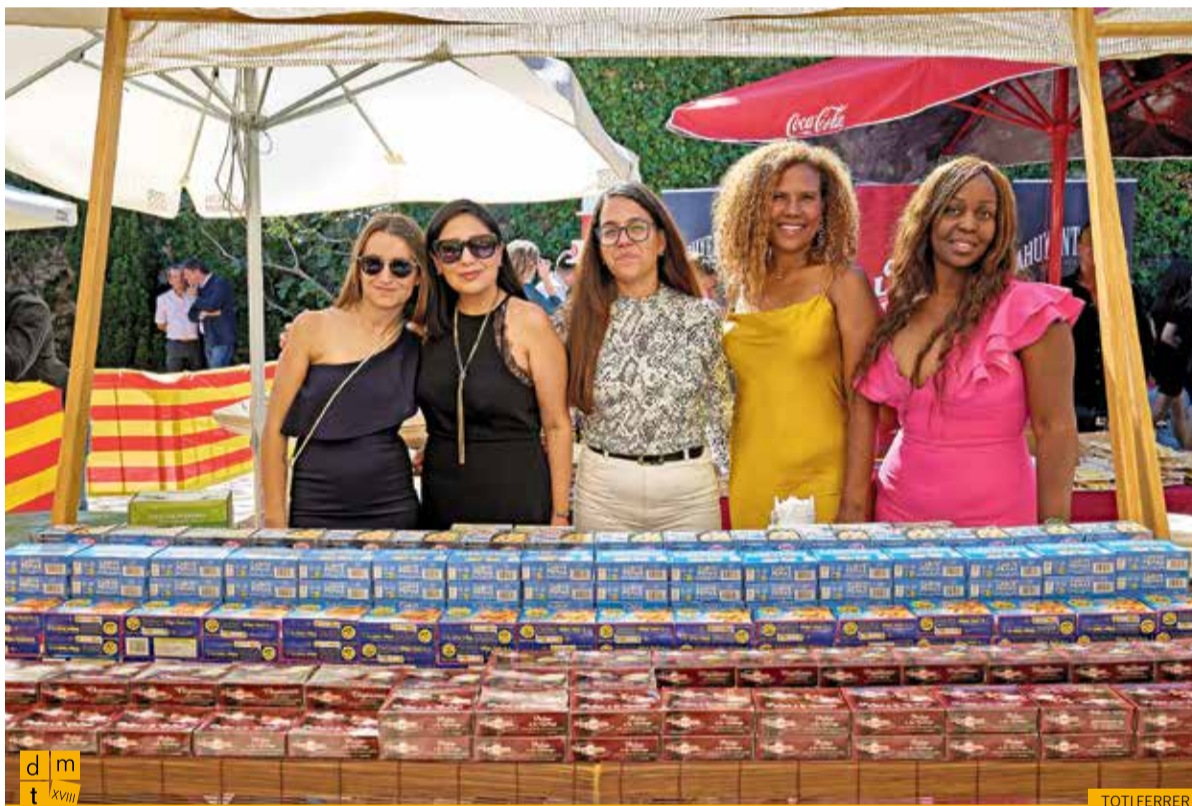
Estand de conserves Cabo de Peñas, DANI, Hoya, Distrial 98, Pay Pay i Pescamar Gourmet