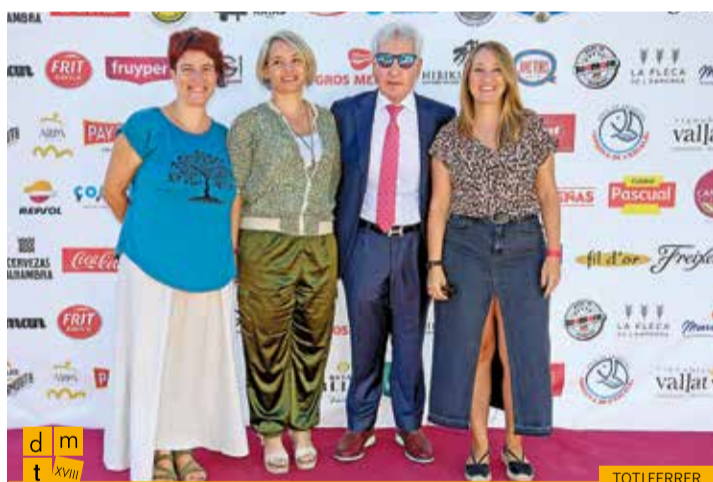
Representants d'Esquerra Republicana de Catalunya a Girona amb el president de la Federació