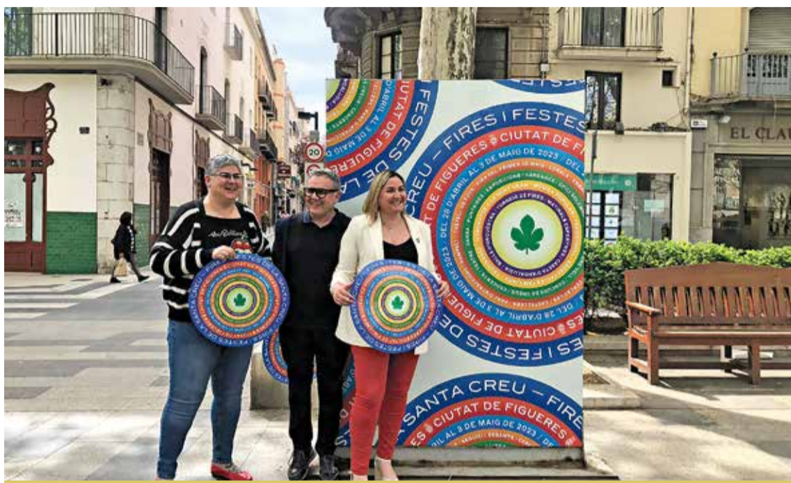
Començant per l'esquerra: la regidora, el dissenyador del cartell i l'alcaldeessa