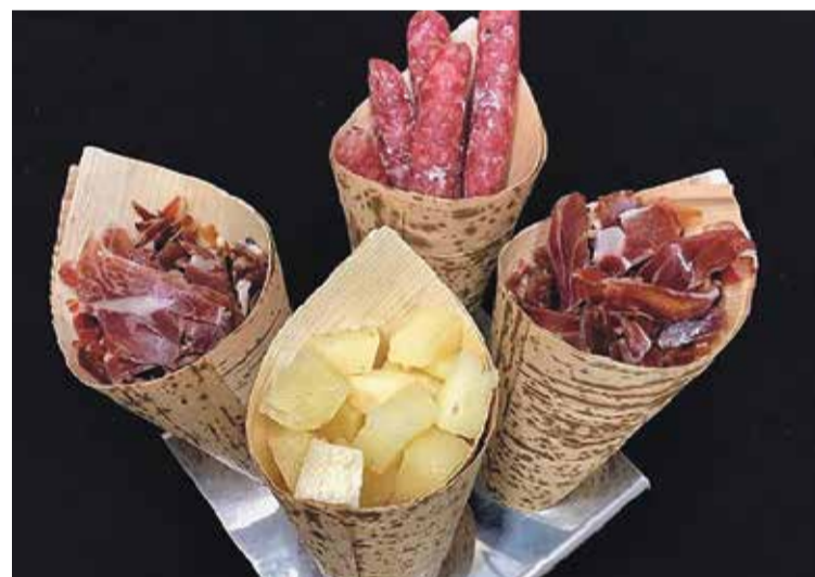
Els preparats de la botiga