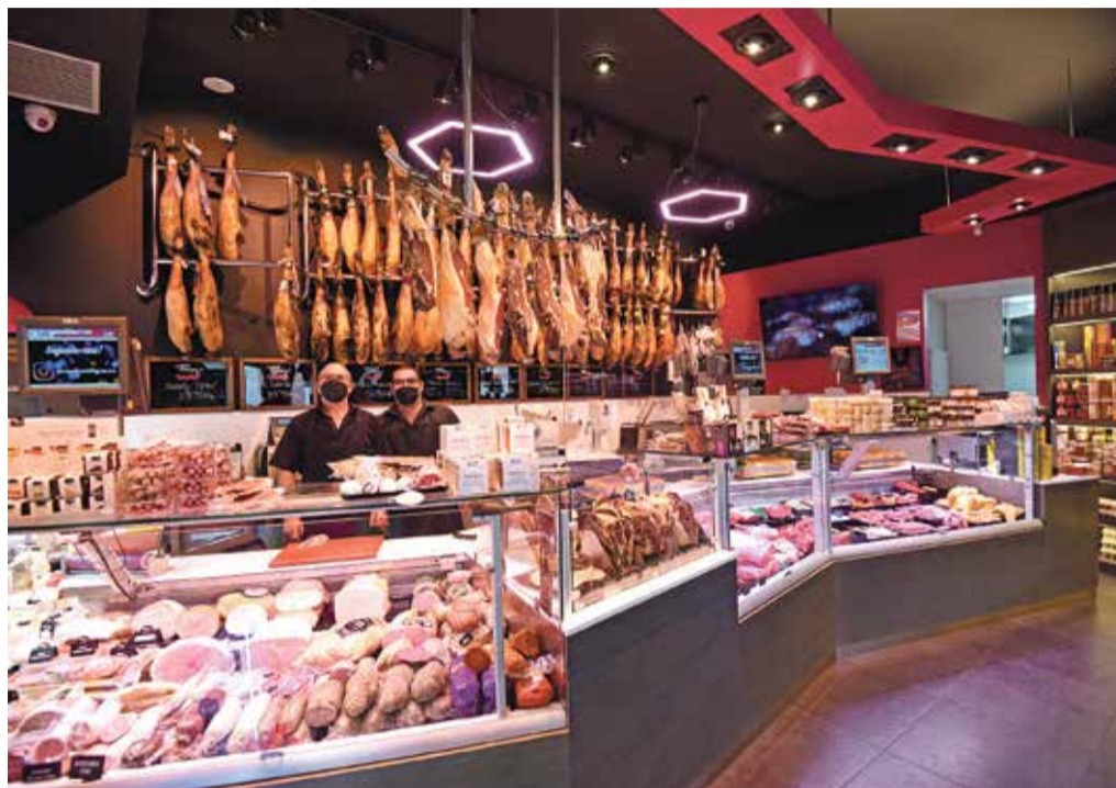
L'interior de l'establiment comercial al carrer Besalú