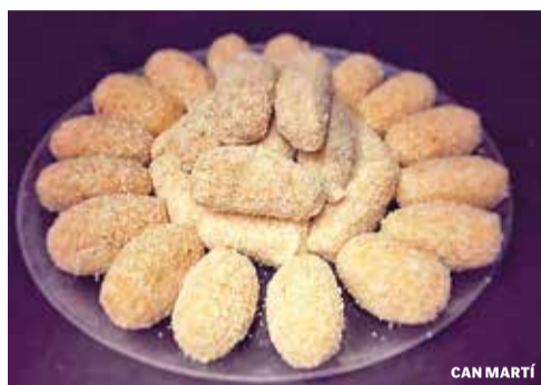
Les croquetes, especialitat de la casa