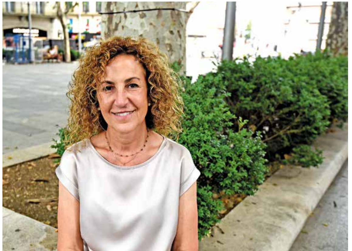
La nova presidenta del Consell Regulador, a la Rambla de Figueres

Penso que aquesta fira ha anat evolucionant cap a positiu i el que hem buscat és que tingui èxit en tots els àmbits, pel públic en general, pel nivell de professionals i perquè sigui una fira de referència de la qualitat del vi de l'Empordà.