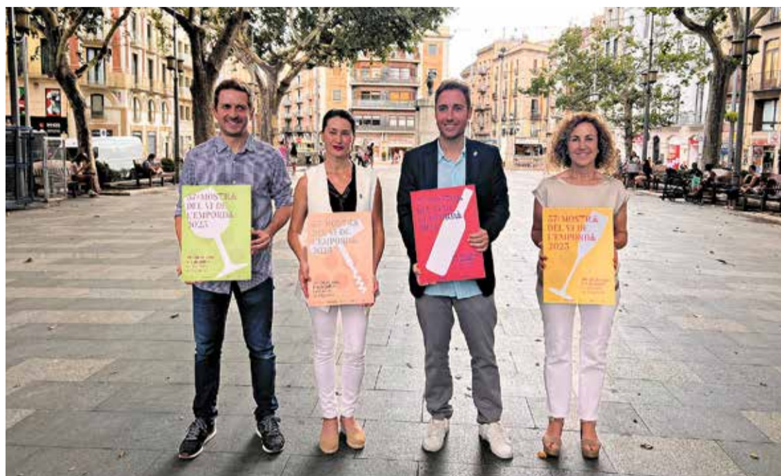
El cartell de la nova edició

LES NOVETATS. La 37a Mostra del Vi presenta una imatge renovada i una nova distribució dels espais. En aquest sentit, la mos-