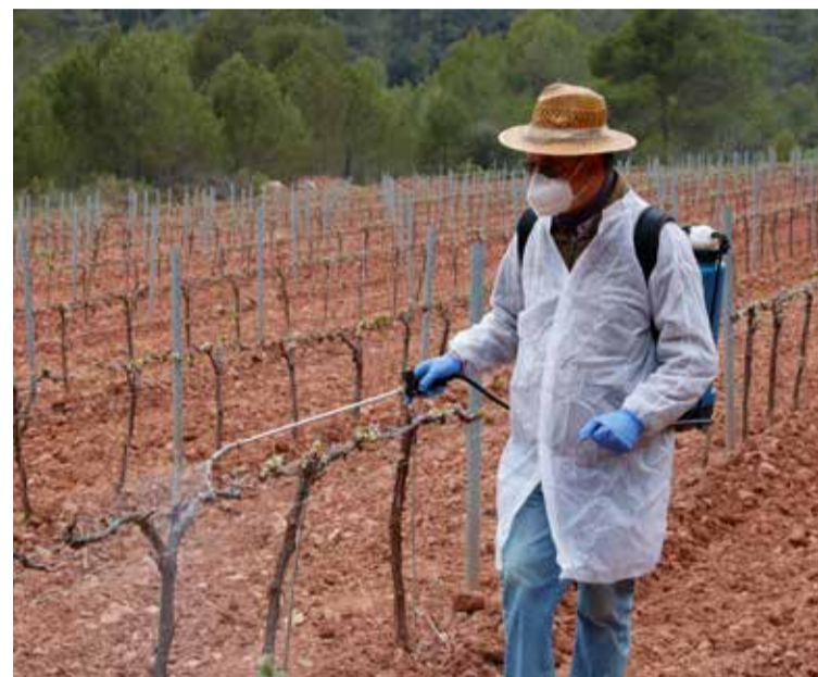
Per controlar les espècies cinegètiques