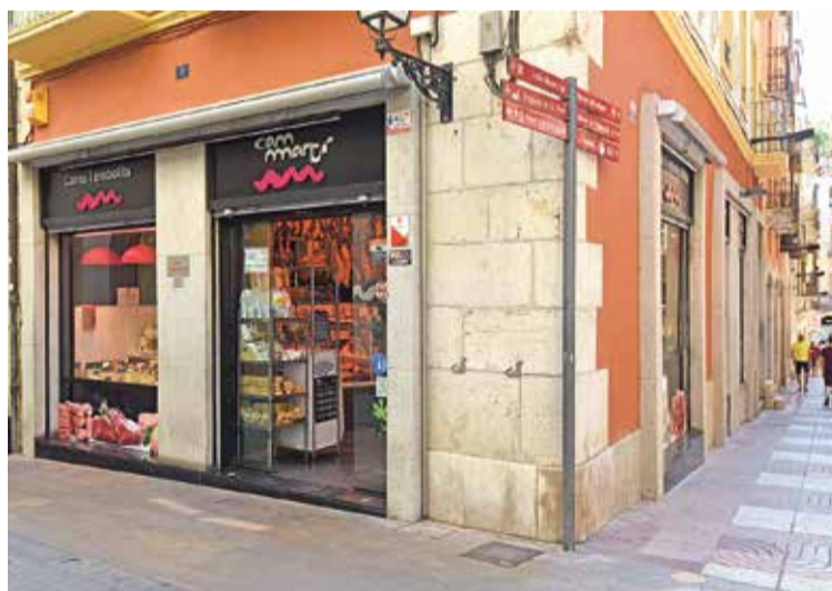
Sempre al servei de la ciutat i la comarca