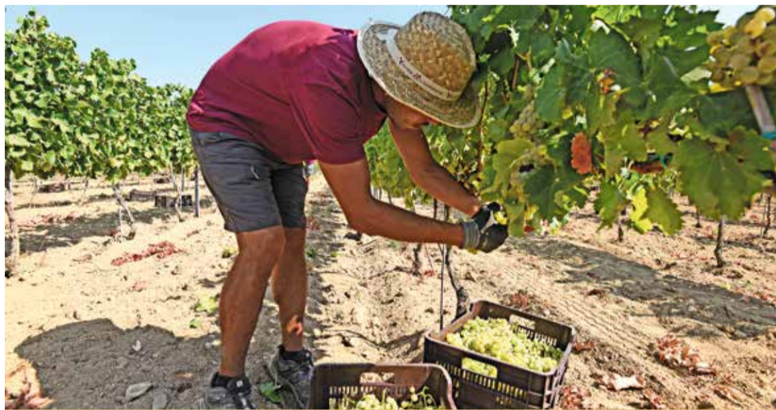
Imatge d'arxiu de la verema de l'any passat

LIMITAR L'IMPACTE. Amb aquesta mesura, l'executiu pretén limitar l'impacte que està tenint la inflació al sector, que està provocant una reducció del consum i conseqüentment una pèrdua d'ingressos per a les empreses. Segons dades de la Comissió, la producció de vi es va incrementar un 4% al conjunt de la UE, mentre que el consum en països com Espanya es va reduir un 10% —