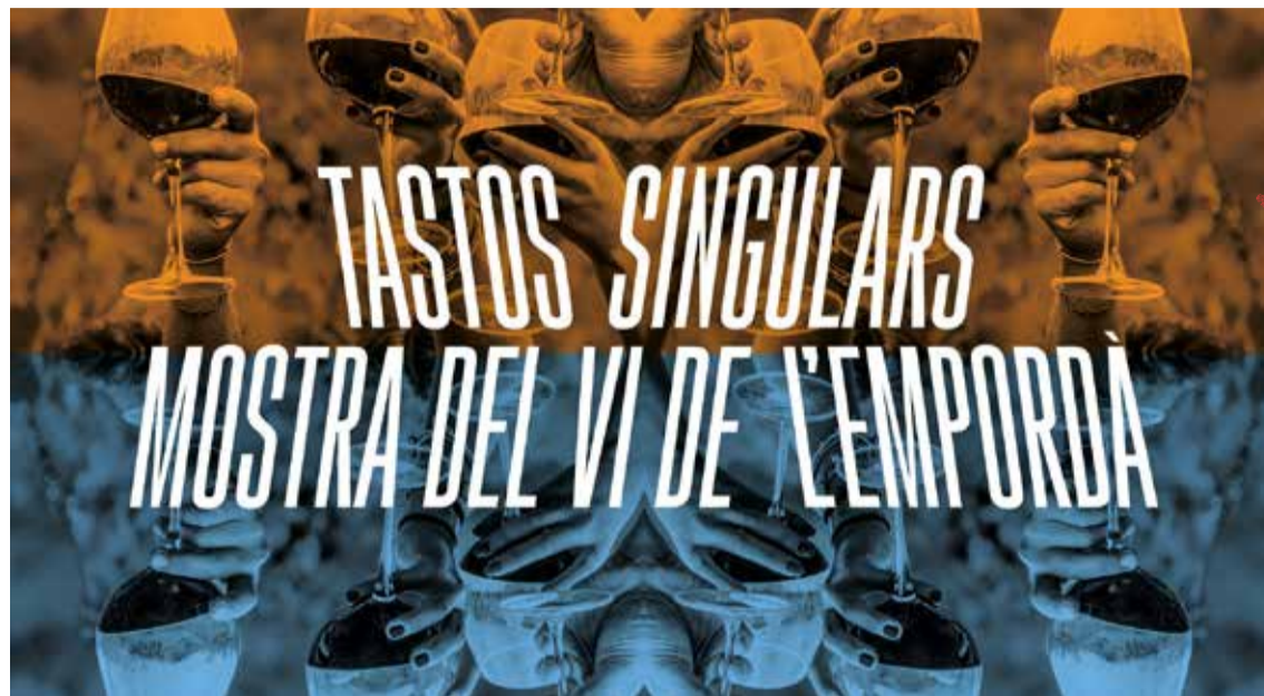
La proposta comptarà amb diferents sommeliers

CINC TASTOS. El Consell Regulador de la DO Empordà ha programat cinc tastos singulars durant la Mostra del Vi de l'Empordà de Figueres. Les activitats tindran lloc, del 28 de juny al 2 de juliol, a