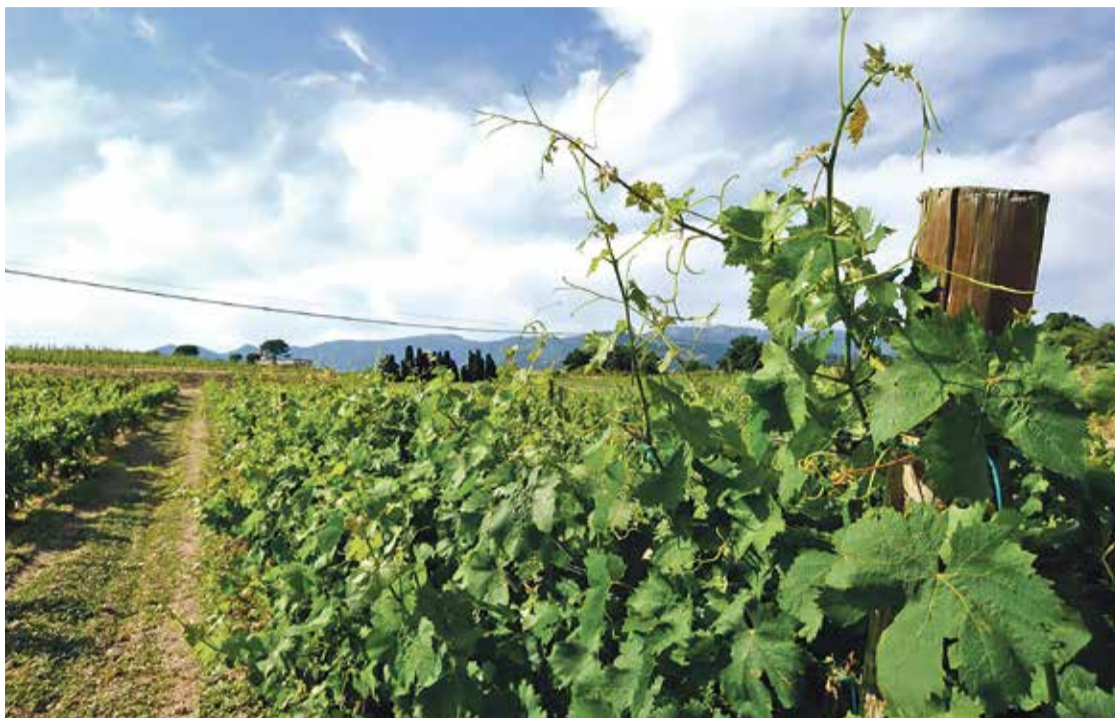
Una part de la vinya del celler Martí Fabra