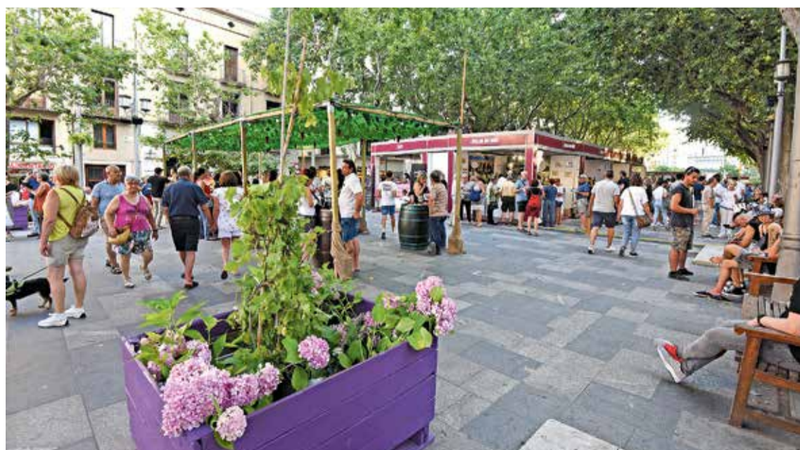
Imatges de la Mostra del Vi de Figueres de l'any passat

29·30 de juny, 1·2 de juliol La Rambla de Figueres