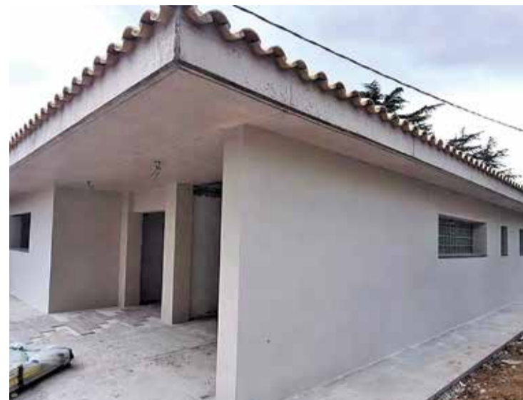
Una de les obres de l'empresa navatencs HORA NOVA