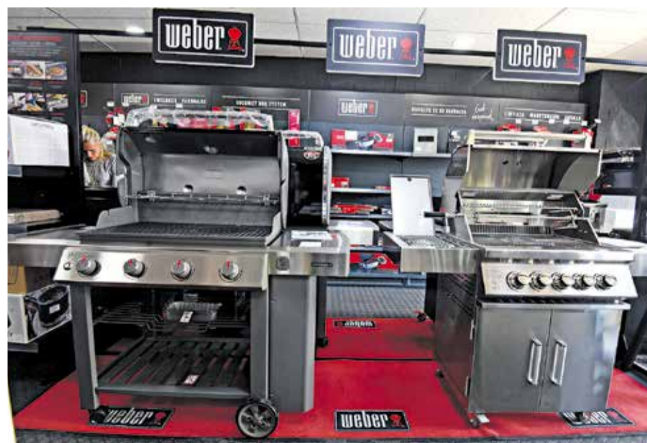
BBQ. L'empresa compta amb les primeres marques del mercat nacional i internacional