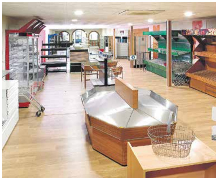
Compten amb un espai expositiu de 400 m 2 MOBILTAC

L'any 2010, amb l'objectiu de prosseguir amb la millora contínua de l'activitat, MOBILTAC SA implanta un sistema de gestió mediambiental basat en la ISO 14001. Des de l'any 2013 és membre de l'Associació Espanyola de Manteniment (FEM-AEM) per tenir la prestatgeria de càrrega mitjana ( picking ) i gran càrrega adequades a les directrius establertes en el sector.