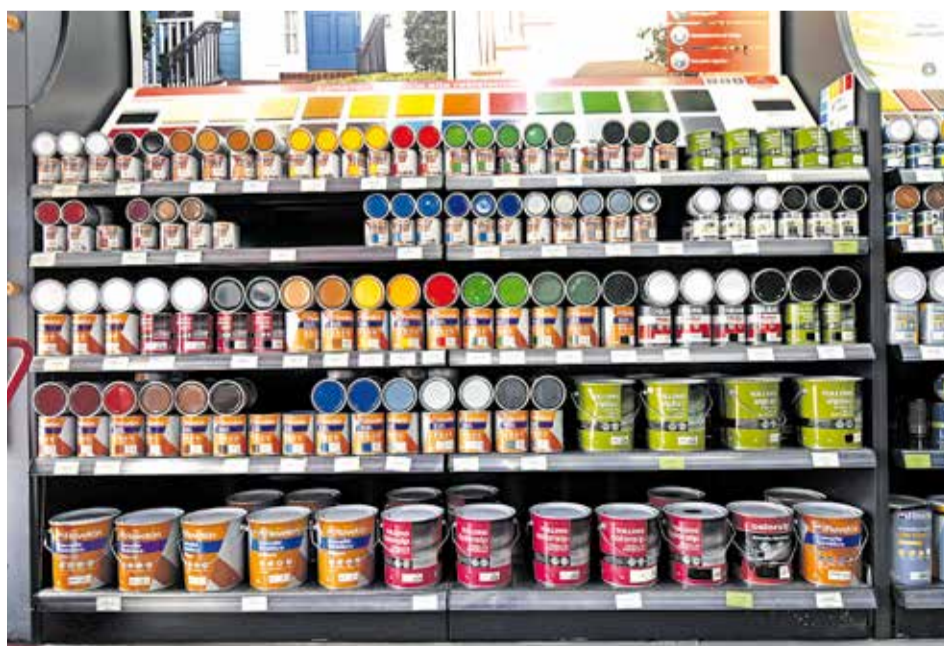
LES NOVETATS. A Jomar hi ha totes les novetats del sector.

A Jomar també disposen d'altres productes com: calefactores, convector, radiadors, radiadors d'oli, estufes, brasers elèctrics, tovallolers, emissors tèrmics, acumuladors de silici, estufes de gas, estufes exteriors, calefactores industrials, estufes de parafina, xemeneies elèctriques, bioxemeneies de sobretaula i estufes de llenya. Alhora, disposen d'accessoris per a xemeneies, mantes elèctriques, humidificadors i sistemes d'aïllament per a llars. Trobareu tota la informació a: www.jomarbrico.com .