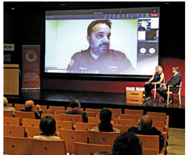
Centre de Ciència i Tecnologia Forestal de Catalunya ACN