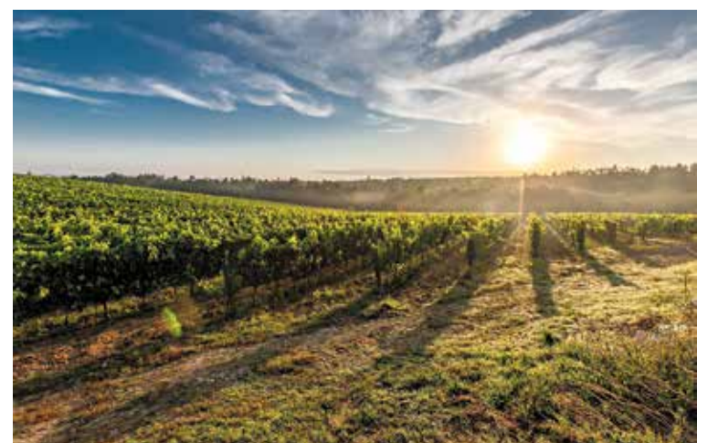
Ja hi ha cellers de Catalunya, l'Estat espanyol i altres països