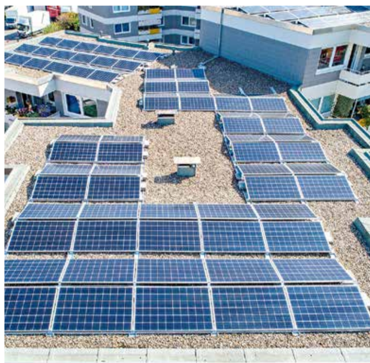
Imatge d'arxiu de plaques solars