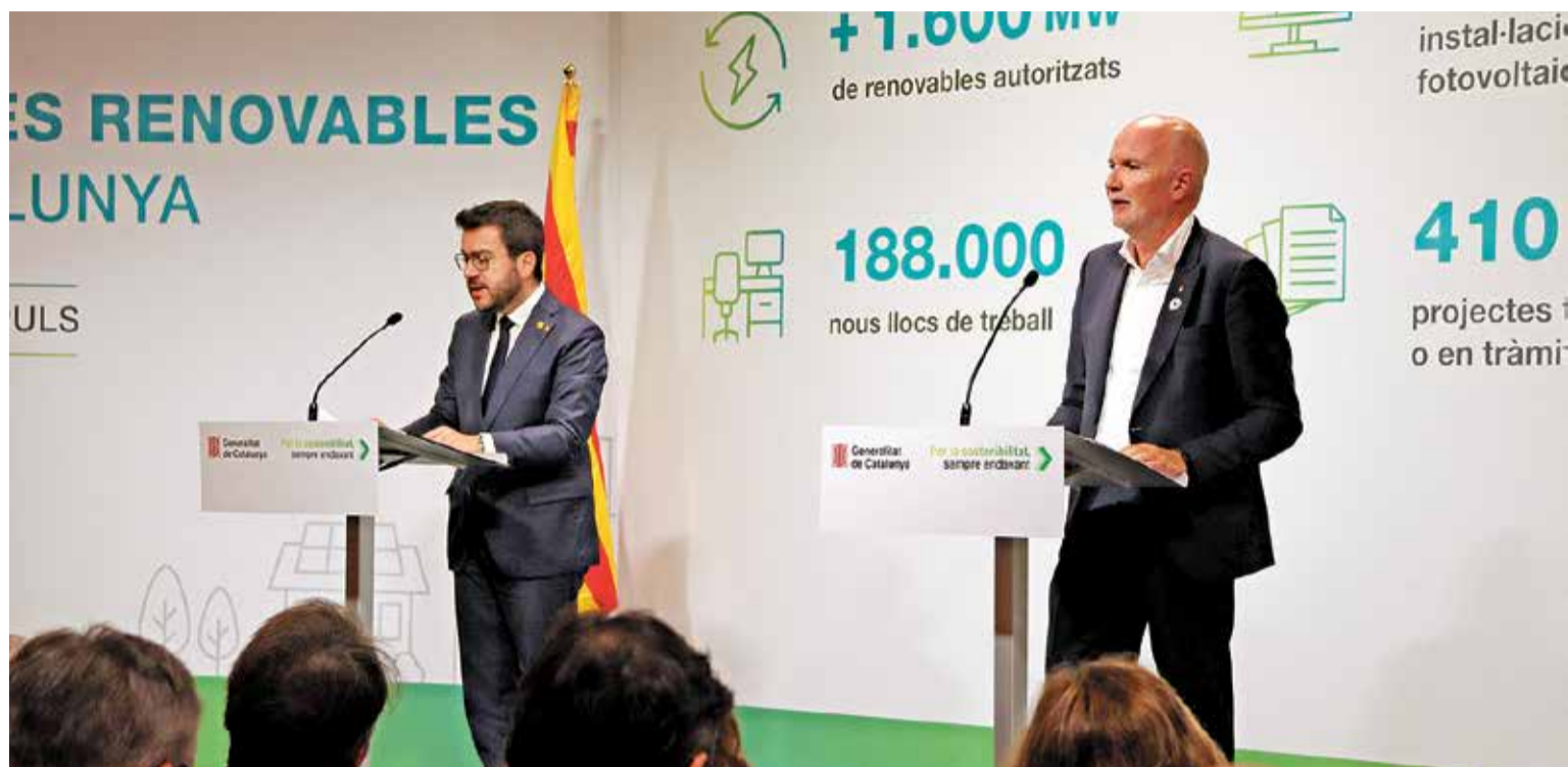
El president de la Generalitat, Pere Aragonès, i el conseller d'Acció Climàtica, David Mascort

PROENCAT. Tot i assegurar que les dades que han presentat són positives, els màxims representants del Govern han admès que en aquests moments l'energia verda només representa un 10% de la potència energètica instal·lada a Catalunya. Els objectius de la Generalitat marcats a la PROENCAT són que el 2030 el 50% de l'energia consumida a Catalunya sigui de font renovable i que el 2050 sigui el 100%. En potència instal·