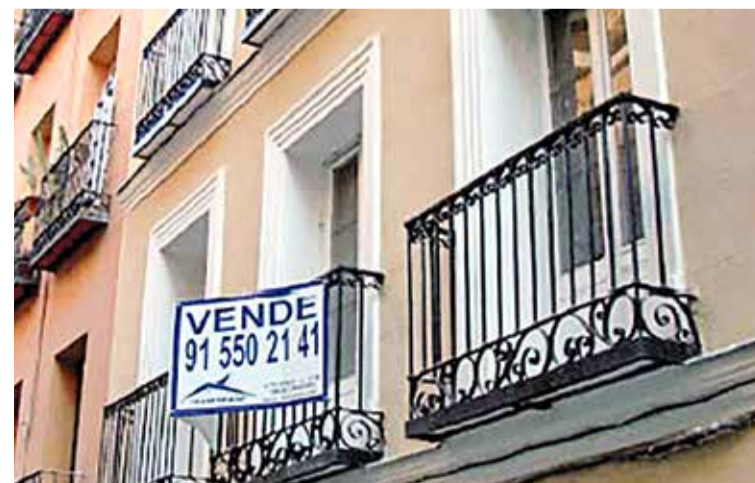
El preu del metre quadrat va pujar un 7,9%