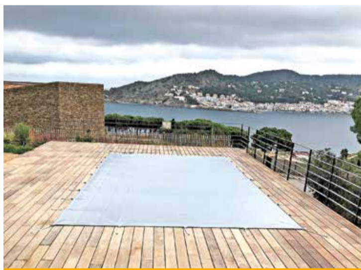
Dos dels cobertors que es poden trobar a Piscines Vilabertran

si d'un litre manté la piscina ben cuidada durant sis mesos. Per acabar, l'empresa recomana l'hibernador líquid especial electròlisi salina o hibernador universal, que és apte per a qualsevol piscina i evita la descomposició de l'aigua, les algues i la calç. Aquest hibernador no té ions metàl·lics que puguin tacar les parets.