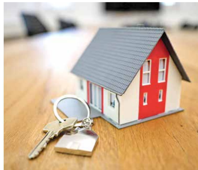
Va retrocedir un 4,2% durant el primer semestre de l'any HN