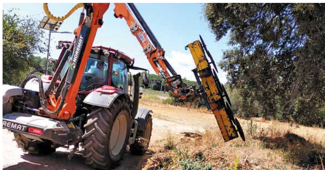
Maquinària especialitzada a fer podes complicades i de difícil accés