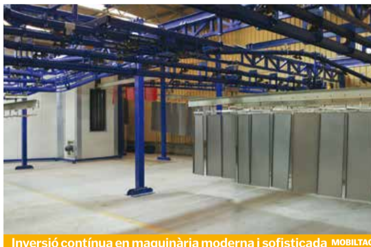
Inversió contínua en maquinària moderna i sofisticada MOBILTAC

EXPOSICIÓ. Disposen d'un espai d'exposició de més de 400 m 2 on poden atendre el client i assessorar-lo per trobar la millor solució per al seu establiment, ja sigui en restauració o realització d'un nou projecte. A MOBILTAC també disposen de molts accessoris per organitzar millor el producte i potenciar les vendes mitjançant