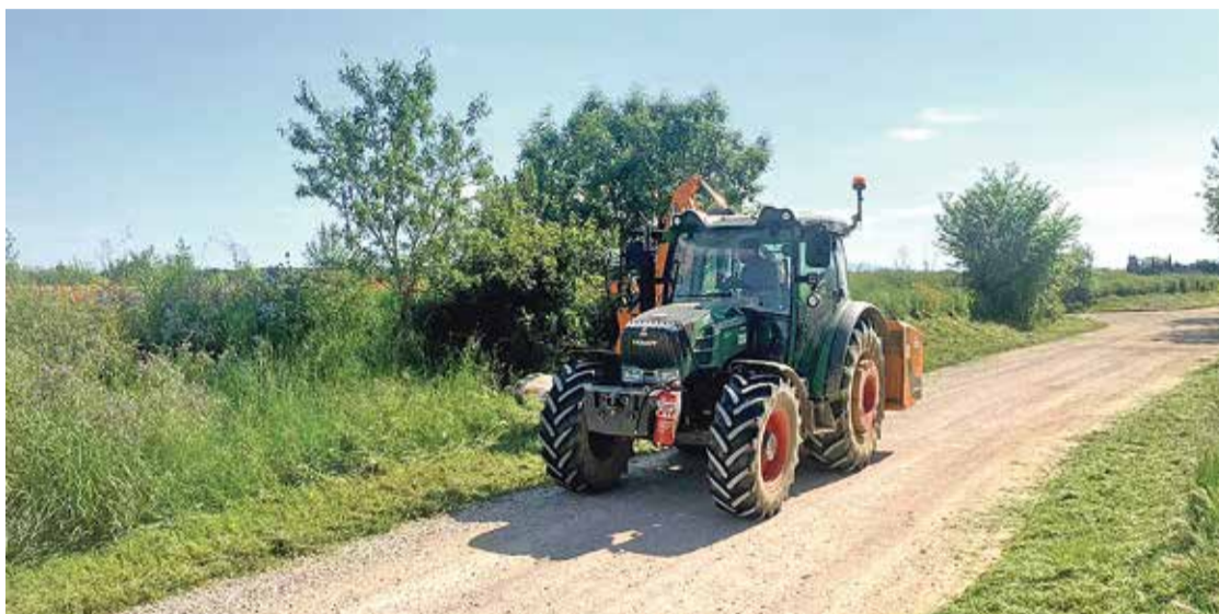
L'empresa també es dedica al trinxat de poda de deixalleries i conreus arborícoles