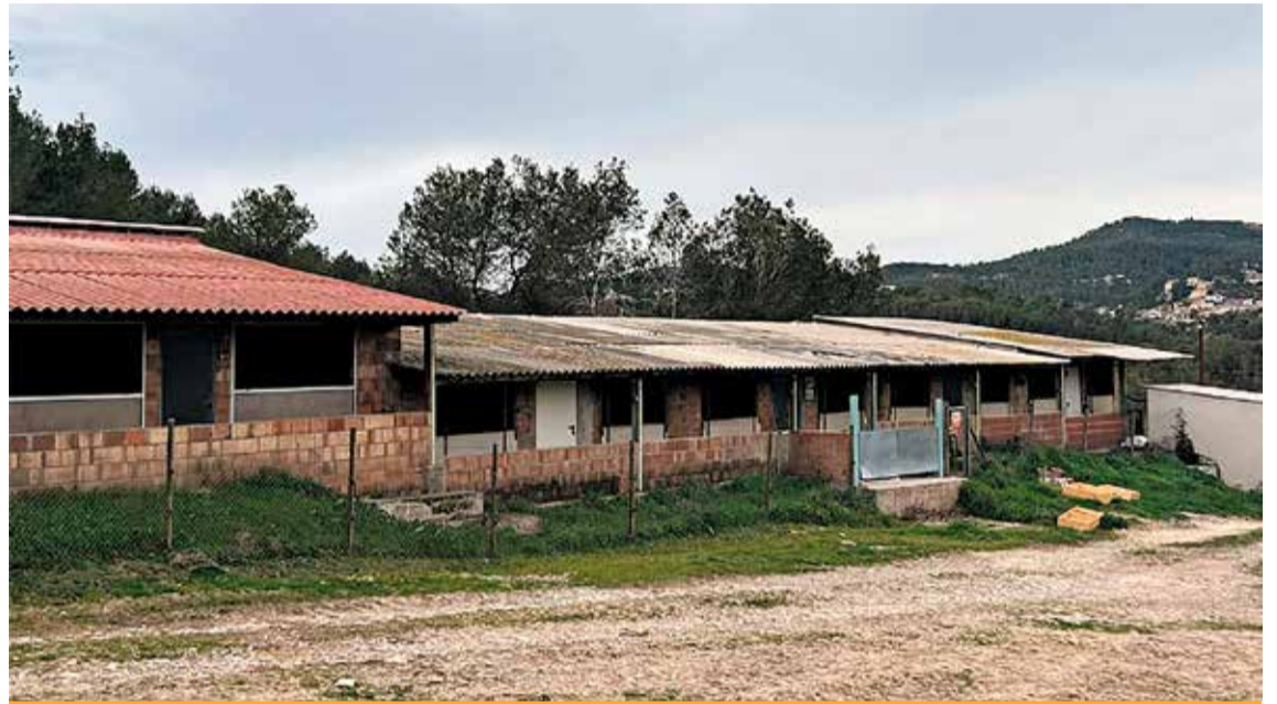
Tota la informació es pot consultar al 'Diari Oficial de la Generalitat de Catalunya' GENCAT