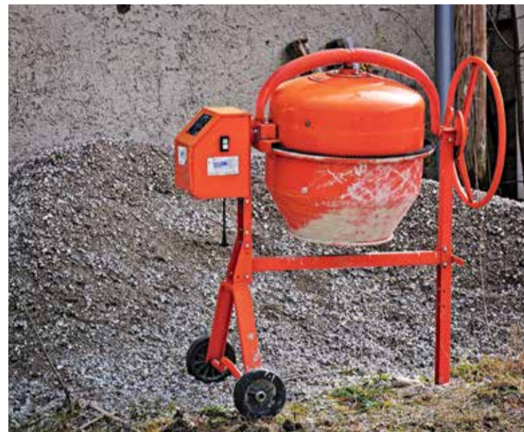
El consum ha registrat una caiguda de l'11,6% HORA NOVA

Tot i això, el consum de ciment de Catalunya al primer trimestre de 2023 ha crescut un 4% i s'ha situat en gairebé 600 mil tones