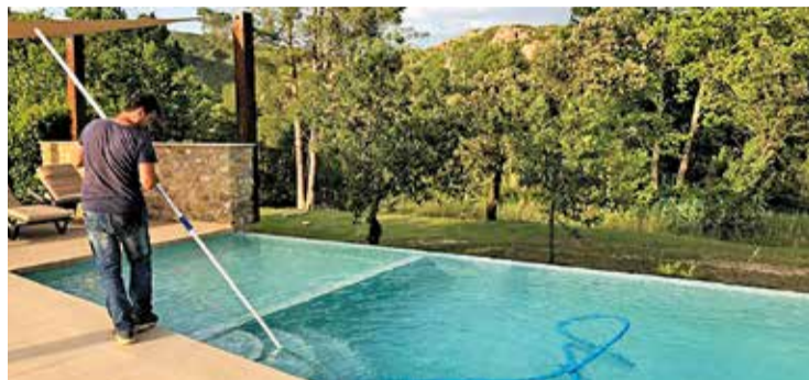
L'empresa s'adapta a les necessitats de cada client P. V.

PREPARACIÓ DE L'ESTIU. Amb l'arribada del bon temps, l'empresa ja treballa en la posada en marxa de les piscines per a la temporada de bany. S'encarreguen del manteniment de tota mena de piscines públiques o privades, cases rurals, hotels i comunitats de propietaris. Al bloc de la seva pàgina web destaquen que «el man-