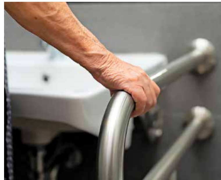
El pressupost dels treballs no pot superar els 8.000 € HN