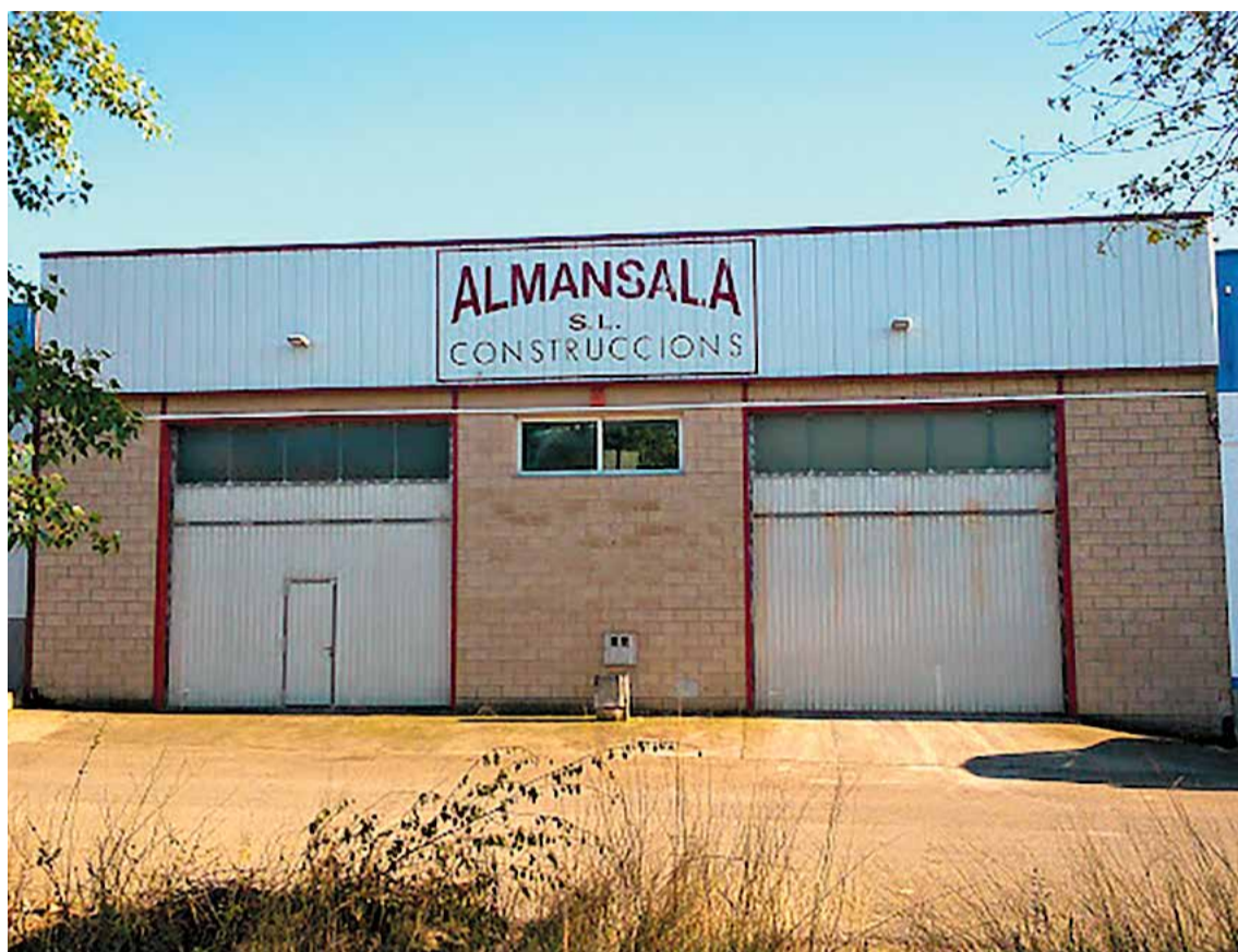
Les instal·lacions del negoci, a Avinyonet de Puigventós