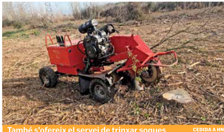
També s'ofereix el servei de trinxar soques

FLOTA RENOVADA. Una de les novetats de l'empresa és que darrerament ha renovat la seva flota de vehicles especialitzats en neteja forestal. Aquesta renovació ve marcada per l'augment del preu dels carburants, per ser més eficients i així disposar d'eines més modernes a l'hora de fer