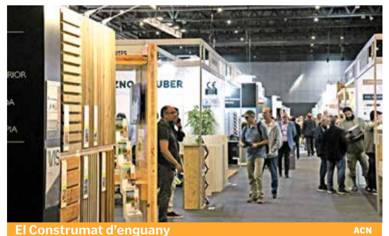
El Construmat d'enguany