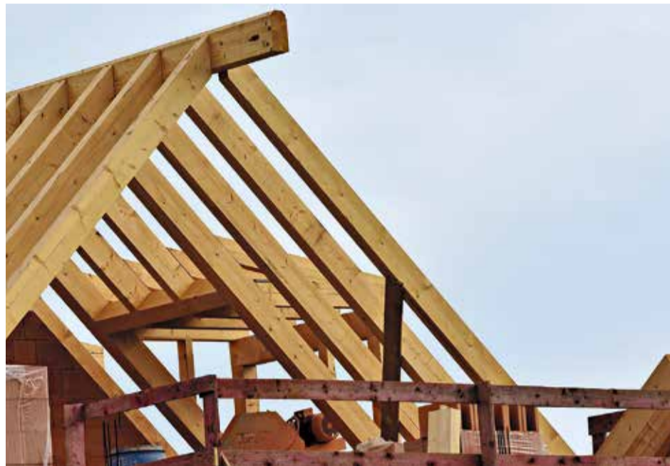
Hi ha qui quantifica l'augment en un 100%

DEMANDA EN AUGMENT. En el marc del saló internacional, una de les conclusions