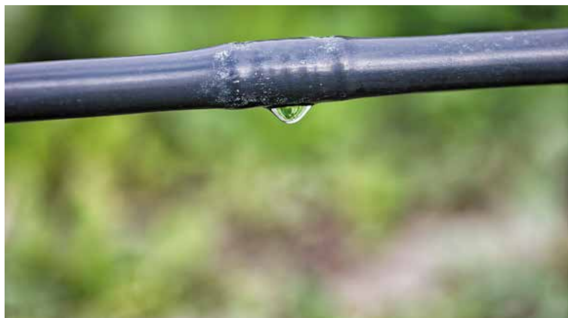
El gota a gota permet regar eficaçment estalviant aigua