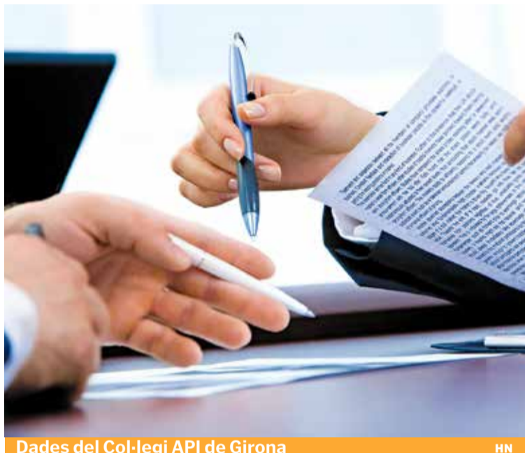
Dades del Col·legi API de Girona

La manca d'oferta d'obra nova fa encarir els preus i exerceix pressió sobre els preus dels habitatges de segona mà