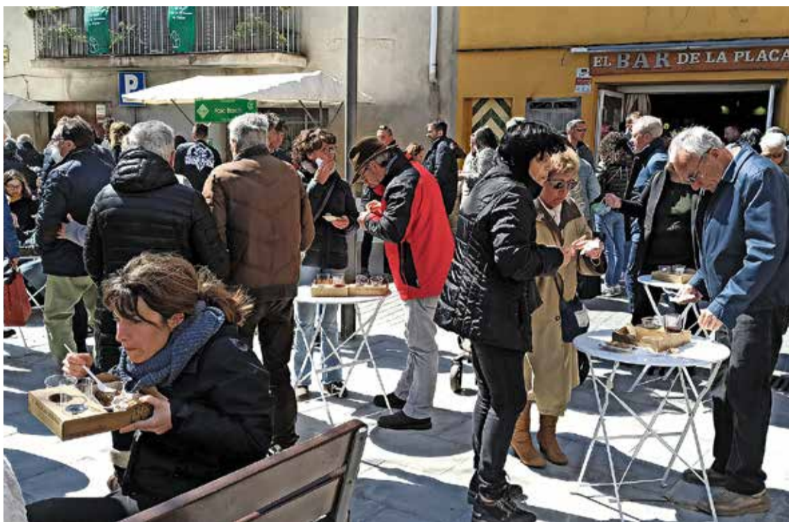
Instants del tast durant la Fira del Conill de l'any passat