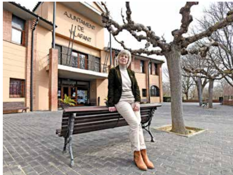
L'ALCALDESSA DE VILAFANT. En la darrera entrevista al setmanari

Com deia, totes les activitats de dissabte es traslladen a Palol Sabaldòria, ja que enguany hem acabat la rehabilitació del mas i l'entorn és fantàstic. En aquest nou espai és on es desenvoluparà tota la programació de jocs infantils i juvenils i una de les activitats més destacades és l' escape room . També cal tenir en compte el maridatge de vins i carn de conill i, per tancar el dia, a l'espai hi haurà furgoteques ( food trucks ) i música ambient per amenitzar la tarda. Aquesta proposta és per ampliar la fira amb activitats més lúdiques i festives i, d'altra banda, mantenim l'essència el diumenge al centre històric i els carrers que envolten la plaça amb la mostra gastronòmica, que també anirà acompanyada de diferents actes com ara tallers, jocs infantils, exposicions de pintura i un showcooking , itancarem amb les havaneres a mitja tarda.