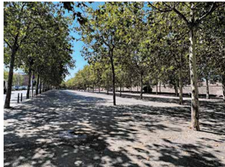
Un dels aparcaments AJ.ROSES