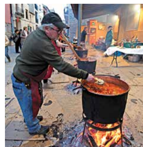
És el ranxo més antic del país À. R.