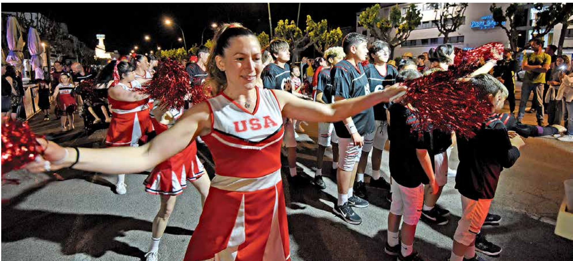
Instants de la gran festa de l'edició anterior