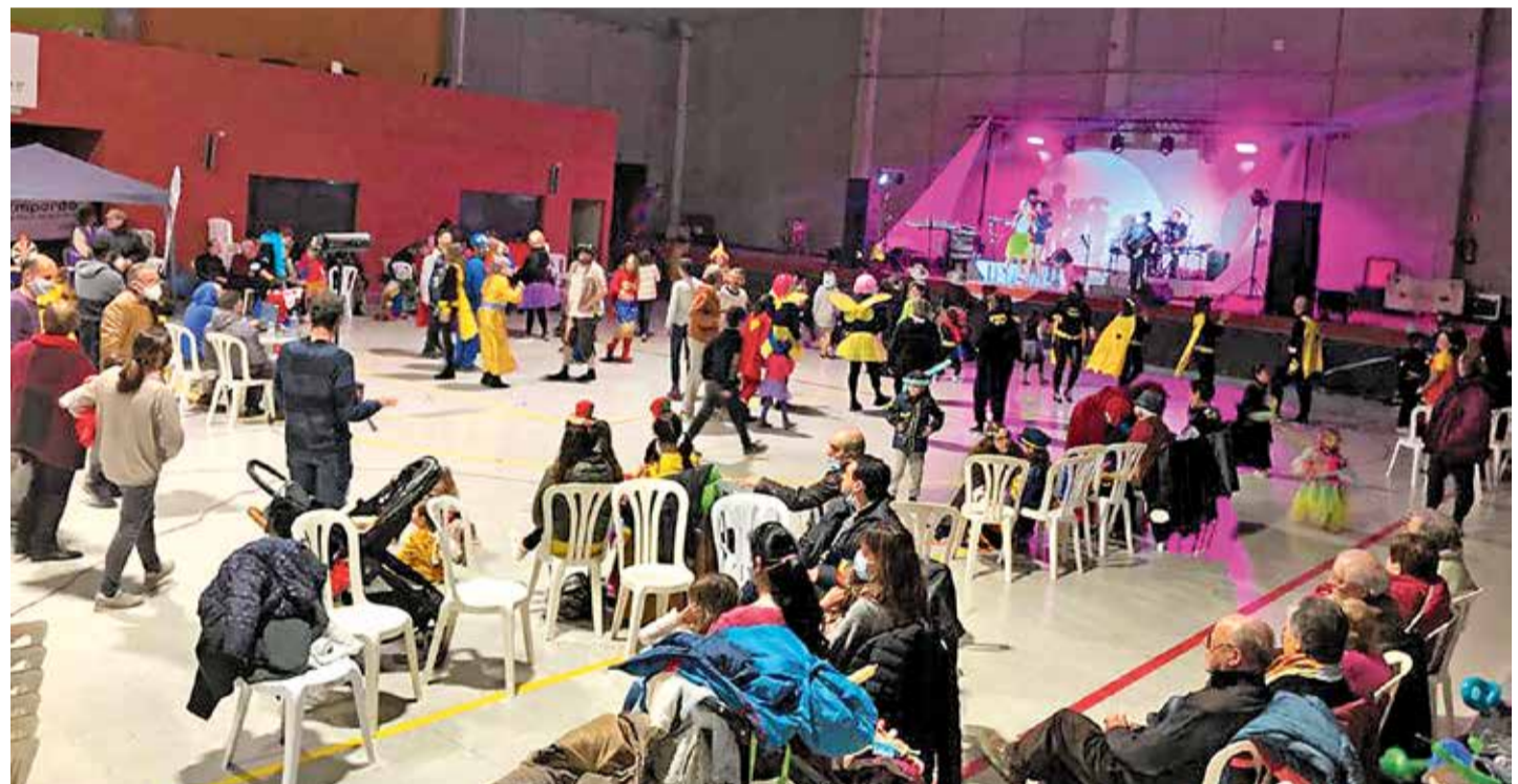
Imatge de la celebració del Carnaval de l'any passat, al pavelló municipal

ELS PREMIS. Cal destacar que durant la nit de dissabte, al final de la festa, es farà entrega de dos premis; el primer premi serà per a la disfressa més original de la vetllada, i també hi haurà un premi per a la persona que millor canti al karaoke.