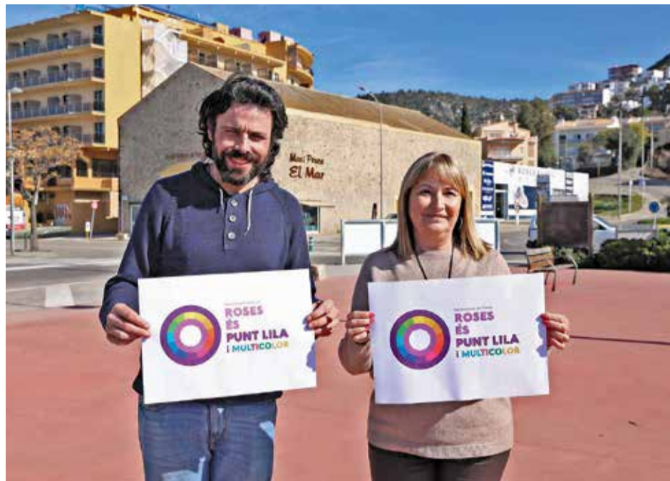
Els punts liles estaran distribuïts en diferents espais (imatge d'arxiu) A.J.R

ENGUANY L'ÚS DE GOTS REUTILITZABLES, QUE L'ANY PASSAT ERA UNA RECOMANACIÓ, HA PASSAT A SER UNA NORMA D'OBLIGAT COMPLIMENT