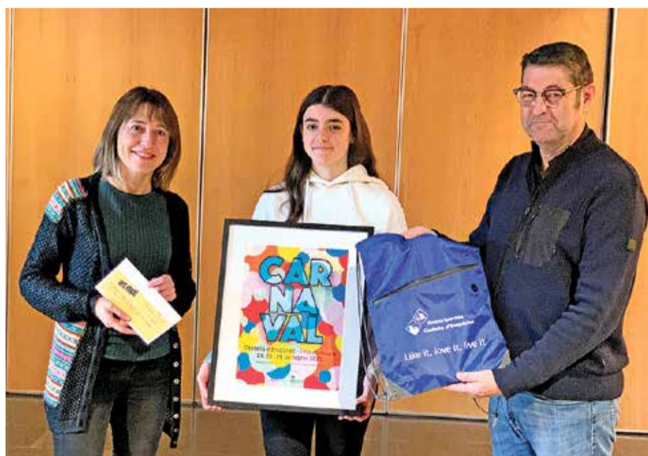
La guanyadora del cartell d'aquesta edició

LA PROGRAMACIÓ. La festa de Carnaval compta amb els grups Lia Jensen, Wasa Cooperation, Tutukeké, el grup d'animació infantil Atrapasomnis i Tramuntakada; i la banda de percussió dels Senyors del Foc, obrint les cercaviles. Enguany les desfilades recuperen el recorregut de sempre. Divendres a la nit se sortirà del carrer Sant Mori (Zona Nit) i s'acabarà a la plaça de les Palmeres; dissabte a la tarda, s'anirà de l'aparcament de la llar d'infants fins a l'aparcament de la l'Escola Joana d'Empúries; a la nit, se sortirà del carrer Peralada (davant del cementiri) i s'acabarà al carrer Santa Clara; diumenge, al matí, se sortirà de la plaça de les Palmeres i es finalitzarà a Sant Mori. La programació detallada la podeu consultar a la pàgina web de l'Ajuntament.