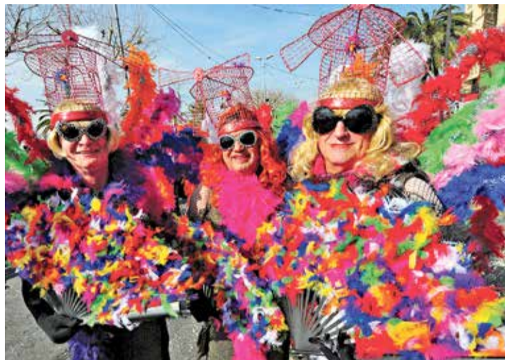
Les imatges es podran visitar a la web del consistori AJ.R

CONCURS OBERT. Es tracta d'una competició oberta a totes les persones aficionades a la fotografia. I, també tal tenir en compte, que quedaran exclosos del concurs aquells participants que