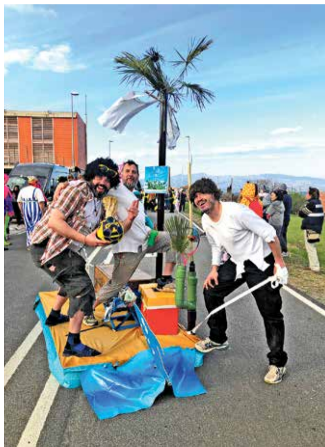
Algunes de les propostes més divertides