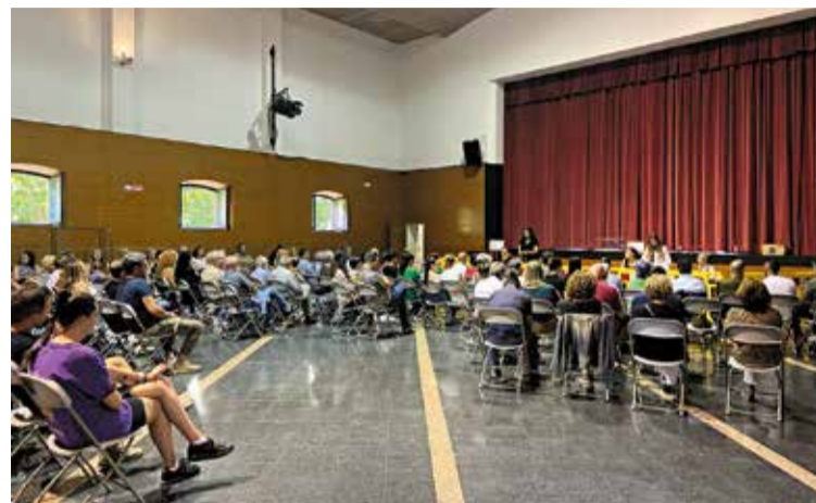
RECOMPTE DE VOTS. La victòria va estar oberta fins al final