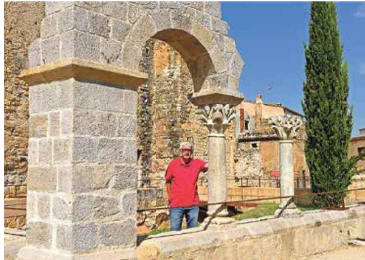
EL FUTUR DEL POBLE. Mira cap un centre d'informació i divulgació

Tenim el riu Fluvià i recentment havíem recuperat un espai molt atractiu per anar a banyar amb la mainada, però malauradament el temporal Glòria ens ho ha desstrassat tot, i la veritat és que ara