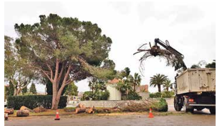
ROSES. Caiguda de pins a Santa Margarida, Mas Mates i zones escolars T. GARCIA