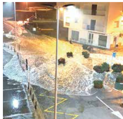
LLANÇA. Onatge de magnitud ELS PESCADORS