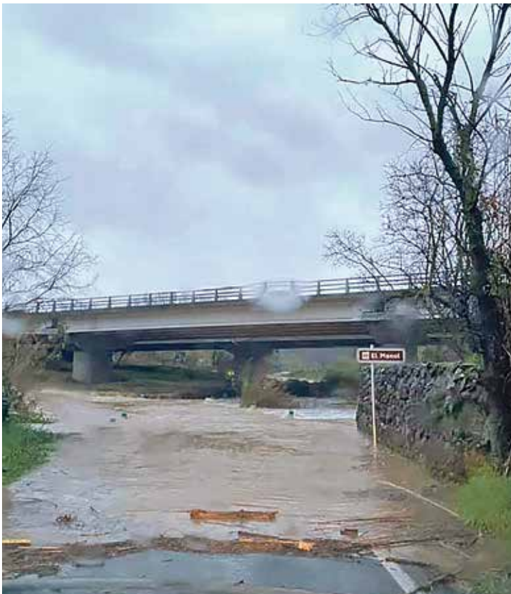
BORRASSÀ. El desbordament del Manol és un clàssic en aquest punt AJ. DE BORRASSÀ

quedar tallada al trànsit la sortida de Roses en direcció Figueres i la prolongació de la Ronda de Circumval·lació. L'accés al camí de ronda entre el Far i l'Almadrava va quedar prohibit. [Fotos: Àngel Reynal]. ■