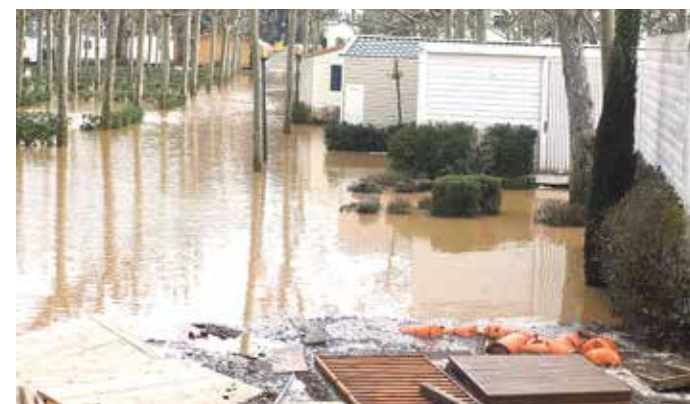
SANT PERE PESCADOR. Més destrosses al càmping Riu ÀNGEL REYNAL