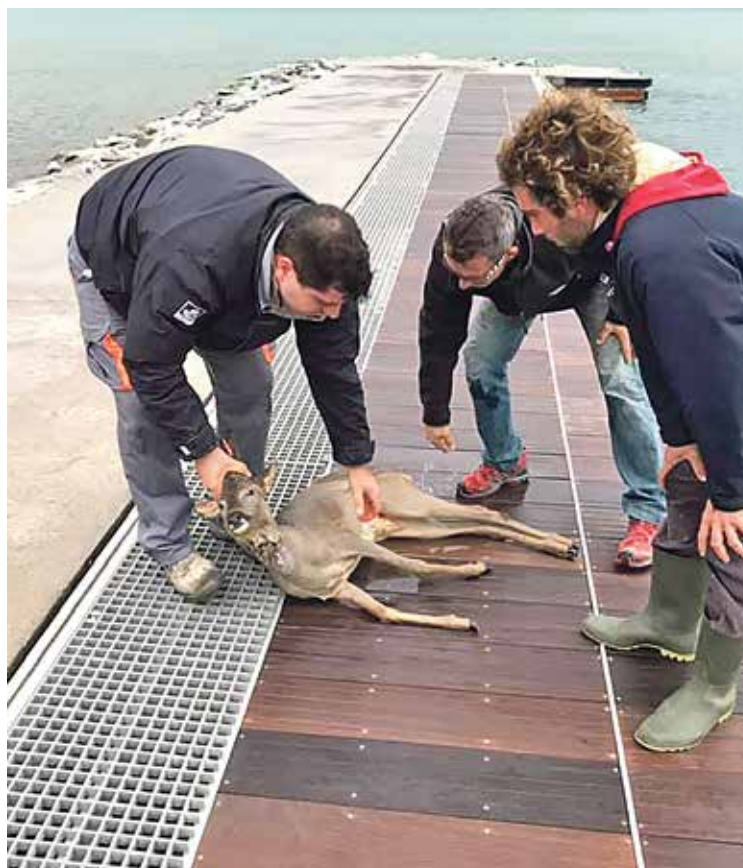
EL PORT DE LA SELVA. Rescatat viu el cabirol que va arribar nedant des del mar AVPC