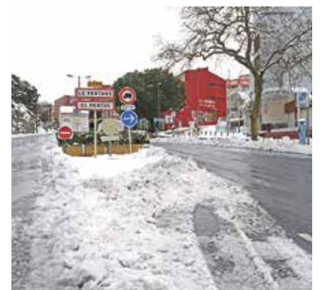
EL PERTÚS. L'enfarinada de dimarts ÀNGEL REYNAL