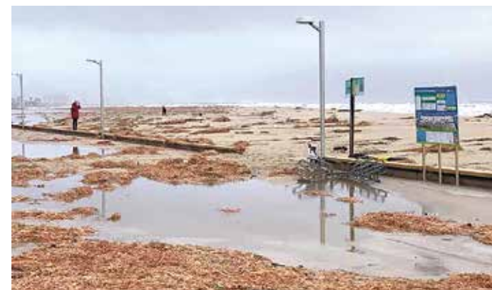
EMPURIABRAVA. Aspecte de la platja i del passeig pel pas del Gloria SALVIGÓELL